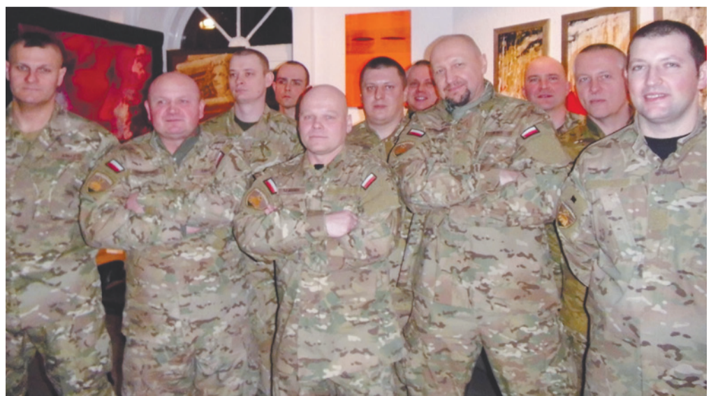
Członkowie Stowarzyszenia na rzecz Obronności Legia Nadnarwiańska

udział w misjach pokojowych gościliśmy w lipcu ubiegłego roku.