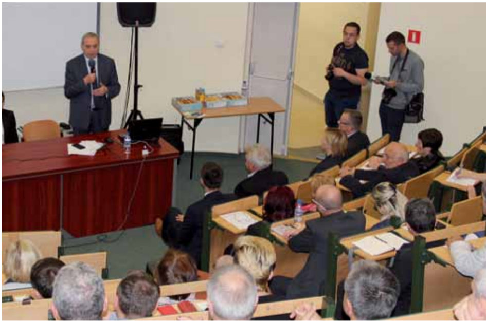
Minister Kowalczyk spotkał się z mieszkańcami Ostrołęki

Mieszkańcy Ostrołęki mieszkający w domach jednorodzinnych będą mogli skorzystać z dotacji na wymianę pieców węglowych, termomodernizację budynków oraz wymianę okien. Wszystko w ramach programu „Czyste powietrze”, którego założenia i możliwości przedstawił w Ostrołęce minister środowiska Henryk Kowalczyk.