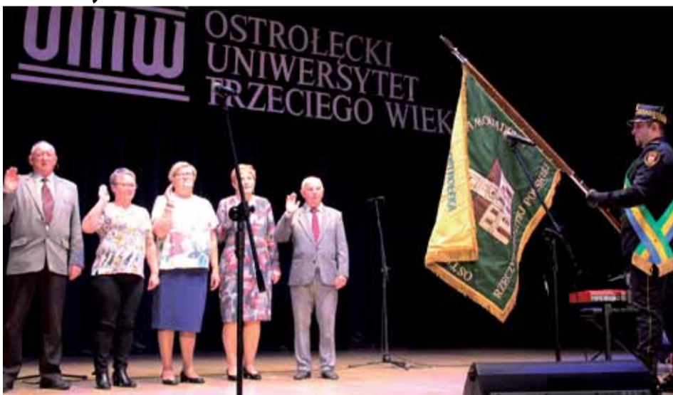
Studentzi pierwszego roku otrzymali legitymacje słuchaczy OUTW

Po raz kolejny rozpoczął nowy rok pracy Ostrołęcki Uniwersytet Trzeciego Wieku. Wykład inauguracyjny poświęcony wzajemnemu oddziaływaniu w procesie wychowania wygłosił prezydent Janusz Kotowski. W zajęciach OUTW uczestniczy około 230 studentów.