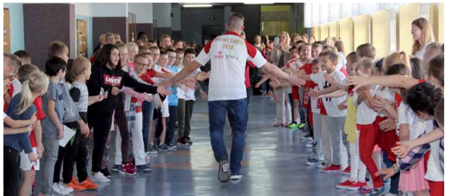
W SP 5 mistrza świata przywitał szpaler uczniów