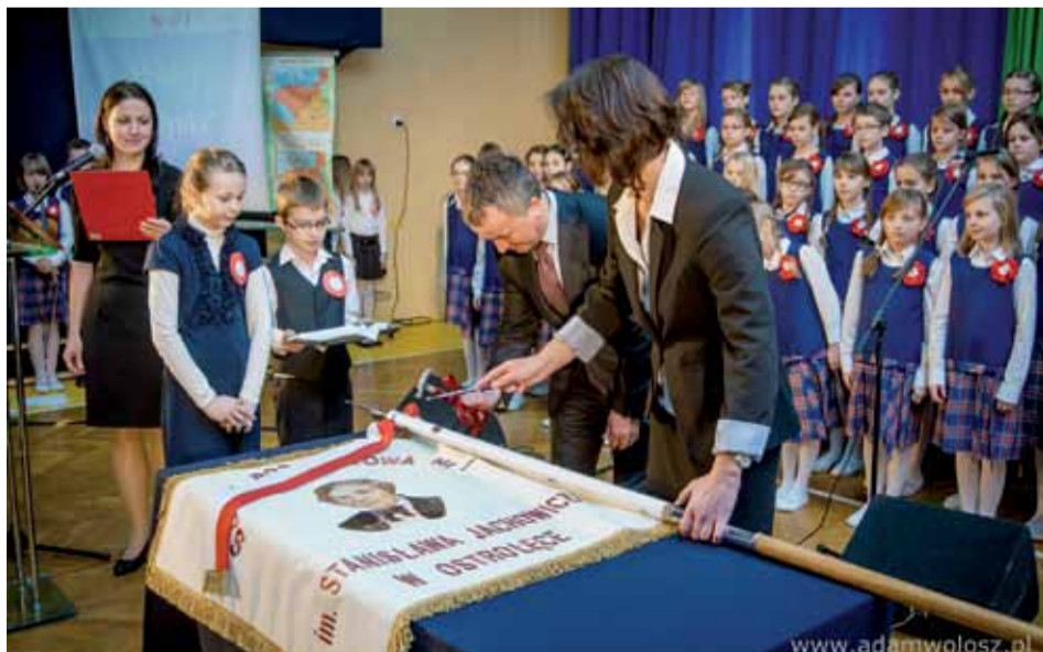
Prezydent Janusz Kotowski podczas uroczystości nadania nowego sztandaru SP nr 1