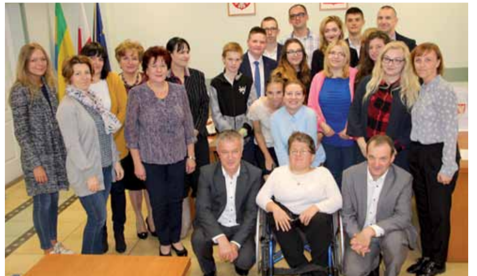
Wolontariusze Radosnego Świetlicobusu z prezydentami Ostrołęki

Ponad miesiąc temu swój coroczny wakacyjny objazd po mieście zakończył Radosny Świetlicobus. Mobilna świetlica odwiedziła wszystkie osiedla w Ostrołęce.