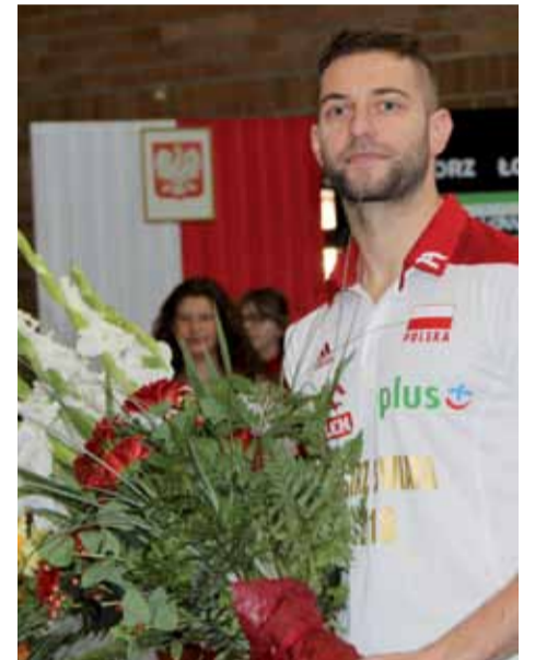
Grzegorz Łomacz - mistrz świata w piłce siatkowej

wanie przegrany pojedynek z Argentyną. Zdradził, że w wolnym czasie, choć jest go mało, ogląda filmy – głównie kryminały i komedie. Na zakończenie skierował ciepłe słowa do najmłodszych adeptów siatkówki, motywując ich do sumiennej pracy na treningach. – Marzę o tym, że kiedyś to ja stanę gdzieś tam z tyłu sali i będę oklaskiwał kogoś z Was – mówił mistrz.