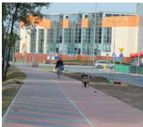
Chodnik i ścieżka rowerowa wzdłuż ulicy Witosza

Dzięki działaniom samorządowym i pozyskanym środkom zewnętrznym w Ostrołęce rozwinie się sieć ścieżek rowerowych. Pierwsze z nich już oddano do użytku, a na kolejne zabezpieczone zostaną fundusze w kolejnym budżecie miasta.