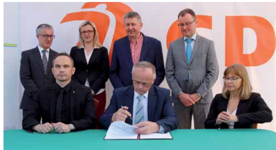
Podpisanie umowy na rozbudowę drogi nr 53

Świetna wiadomość dla naszego miasta i regionu. Rozpisano przetarg związany z budową I etapu obwodnicy Ostrołęki (odcinek do DK 53).