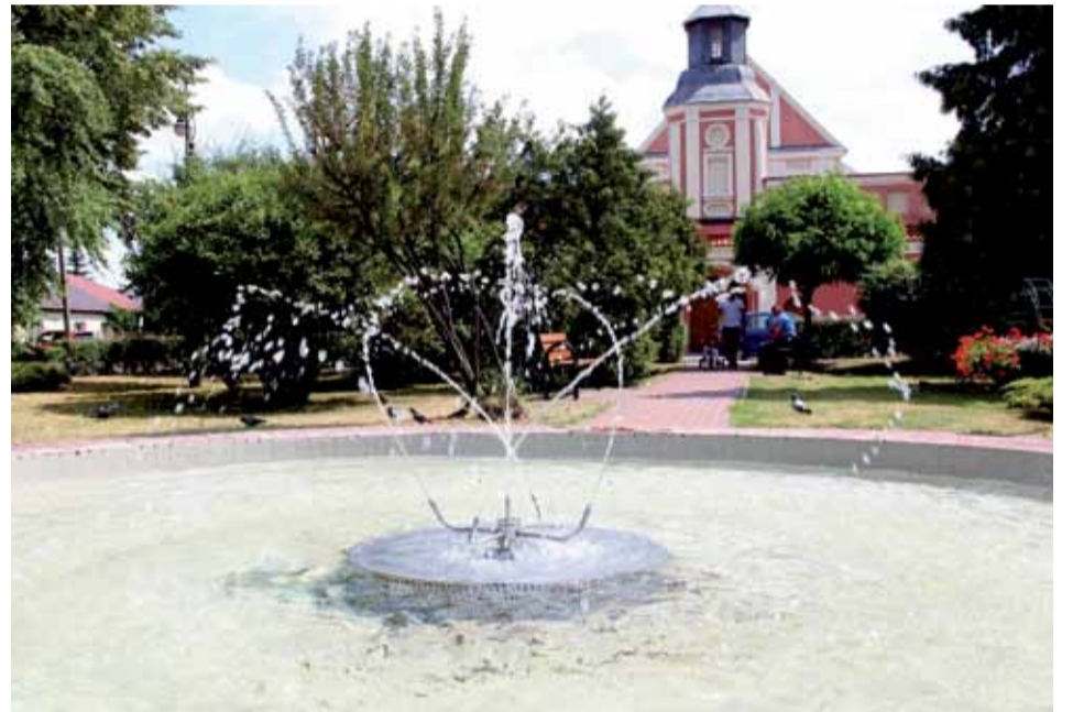
Odnowiona fontanna na skwerze kard. Stefana Wyszyńskiego