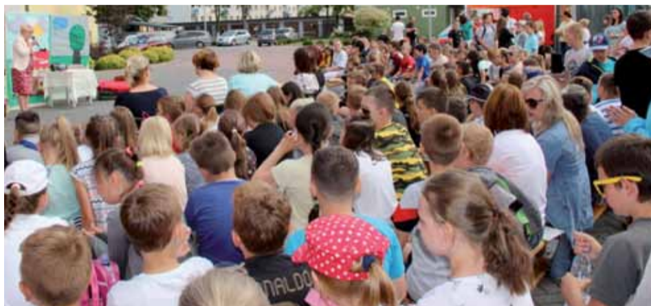
W pikniku wzięły udział dzieci ze wszystkich ostrołęckich szkół podstawowych

W Szkole Podstawowej nr 6 odbył się Piknik Miejski „Zachowaj Trzeźwy Umysł”. Uczestniczyli w nim uczniowie wszystkich szkół podstawowych w Ostrołęce wraz z opiekunami.