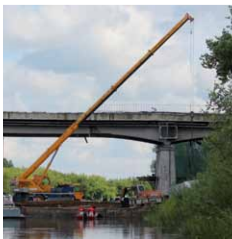
Trwają prace na starym moście

Zakończyły się za to prace przy ulicy Konwaliowej. Roboty drogowe prowa-