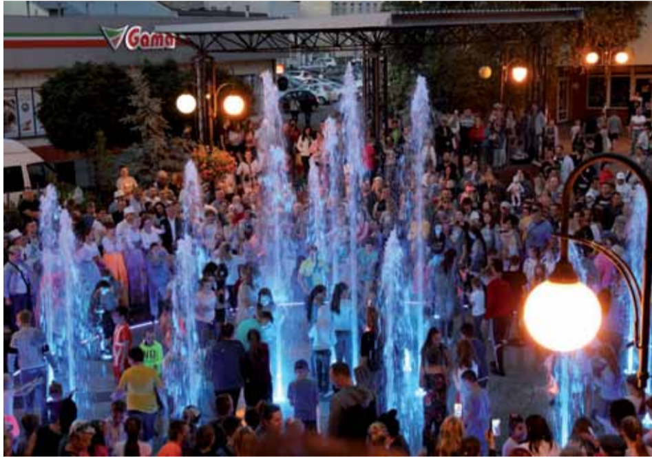
Na otwarcie fontanny przybyły tłumy ostrołęczan

Tłumy ostrołęczan – tych małych i dużych – przybyły wieczorem 7 czerwca w okolice sceny przy D.H. Kupiec, by wspólnie uruchomić fontannę spacerową.