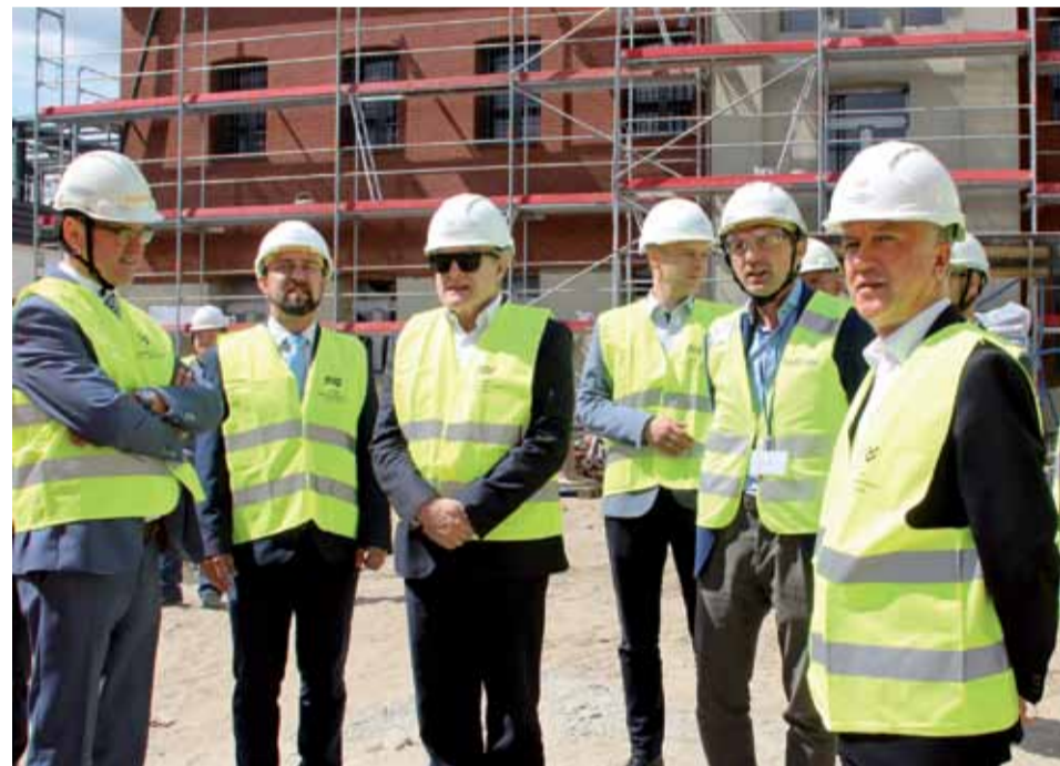
Wicepremier Gliński zapoznał się ze stanem robót w Muzeum Żołnierzy Wyklętych