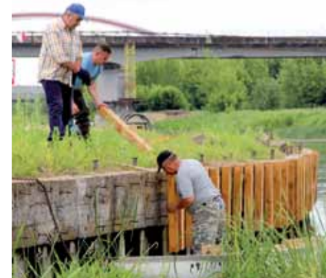
Na nadbrzeżu pojawiły się nowe odboje