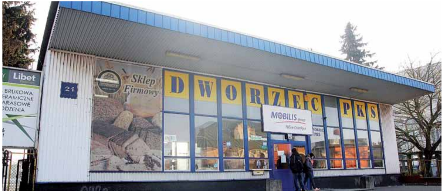
Obecny wygląd ostrołęckiego dworca PKS

Polski państwowy przewoźnik działający na Mazowszu podpisał umowę w sprawie administrowania terenem dworca PKS w Ostrołęce. Firma Polonus oficjalnie rozpoczęła swoją działalność w Ostrołęce z dniem 1 lipca.