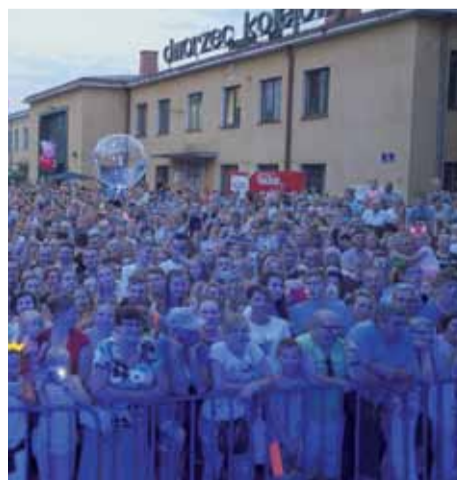
Publiczność czeka na występ gwiazdy wieczoru...