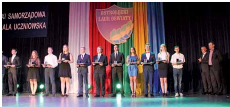
Podczas dorocznej gali ostrołęcki samorząd nagradza najwybitniejszych uczniów