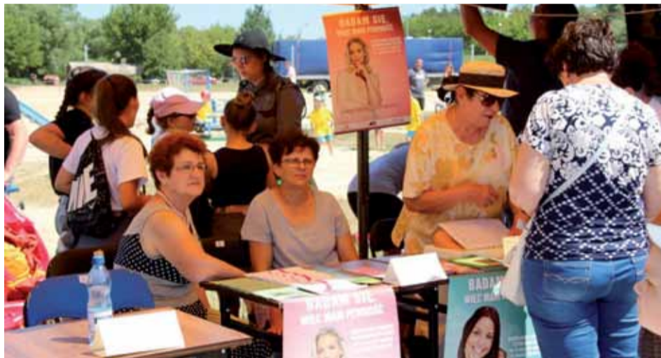
Piknik Zdrowia oferował m.in. darmowe badania, konsultacje i kiermasz rękodzieła

gli zagrać również w grę miejską o Ostrołękę i sprawdzić swoją wiedzę o małej ojczyźnie.