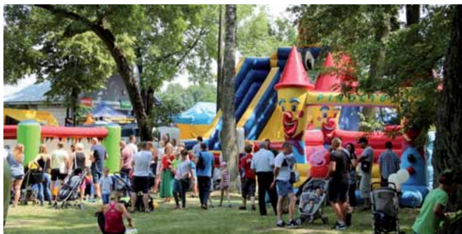
Po raz kolejny w dniu festynu okolice dworca zatętniły życiem