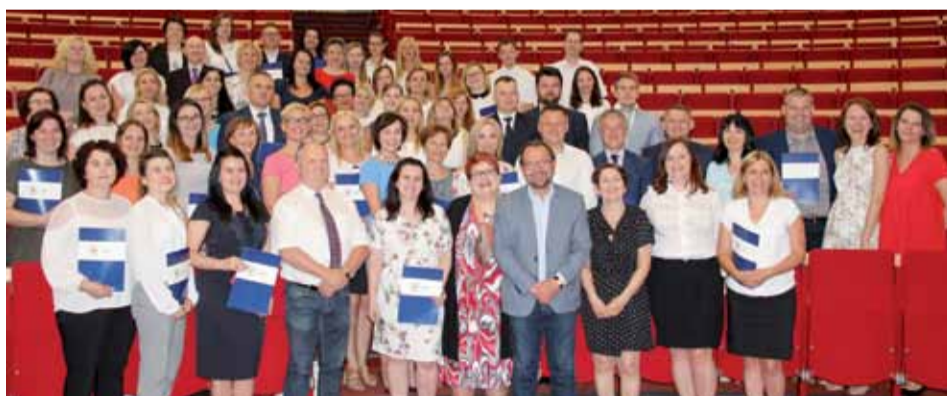
Tegoroczní absolwenci studiów podyplomowych Wyższej Szkoły Administracji Publicznej