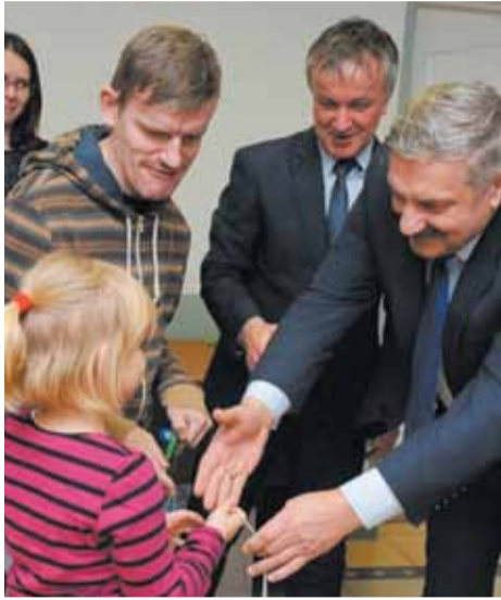
Klucze do mieszkań otrzymały kolejne rodziny

Trzydzieści sześć rodzin otrzymało klucze do mieszkań w nowym bloku Ostrołęckiego Towarzystwa Budownictwa Społecznego. Jego budowa rozpoczęła się w październiku 2016 roku, a zakończyła w lutym 2018 r.