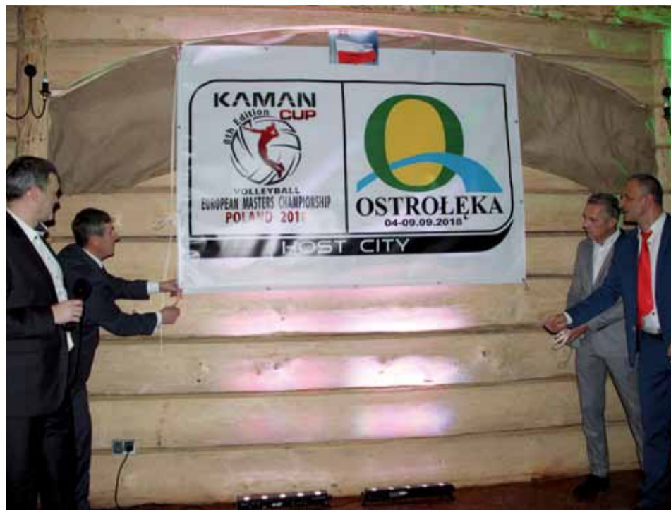
Uczestnicy Balu Siatkarza jako pierwsi dowiedzieli się o planowanych mistrzostwach