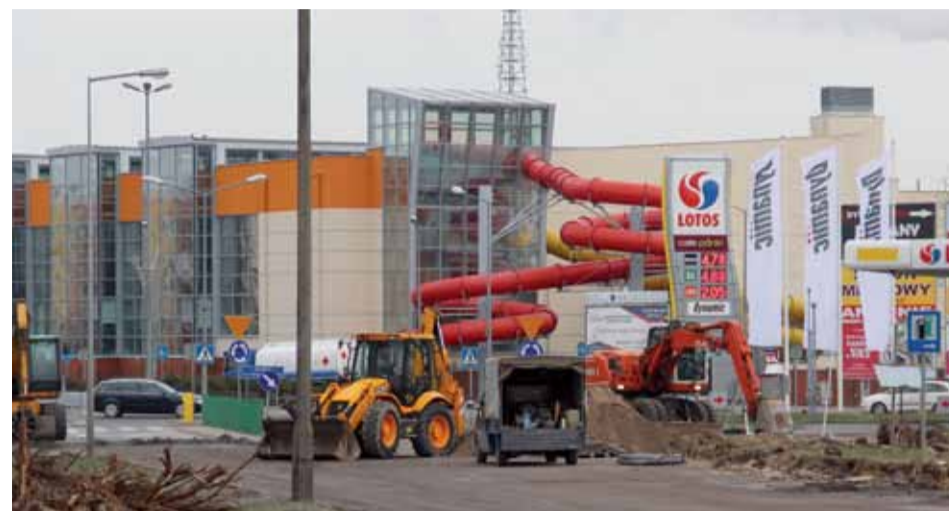
Prace na ulicy Witosa weszły w zaawansowany etap

Kalendarzowej zimie towarzyszą temperatury oscylujące w okoliczności zera stopni i niewielkie opady śniegu. Takie warunki sprzyjają kontynuacji miejskich inwestycji drogowych.