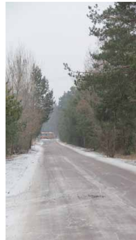
Ulica Krańcowa wkrótce zmieni swoje oblicze

W styczniu rozstrzygnięto przetarg na remont ulicy Krańcowej. Wkrótce na placu budowy pojawi się wykonawca. Przebudowa ma zakończyć się w na przełomie lipca i sierpnia 2018 roku.