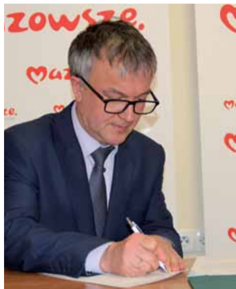
Prezydent podpisuje umowę w imieniu miasta

- Ścieżka rowerowa wraz z chodnikiem w odcinku ul. Goworowskiej od ronda płk. R. Kuklińskiego do ul. gen. Tomasz Łubieńskiego, ul. Brata Zenona Żebrowskiego oraz ul. Pomian