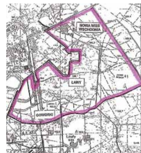
Nowo utworzone ostrołęckie osiedle Leśniewo obejmuje tereny przyłączone do naszego miasta w styczniu