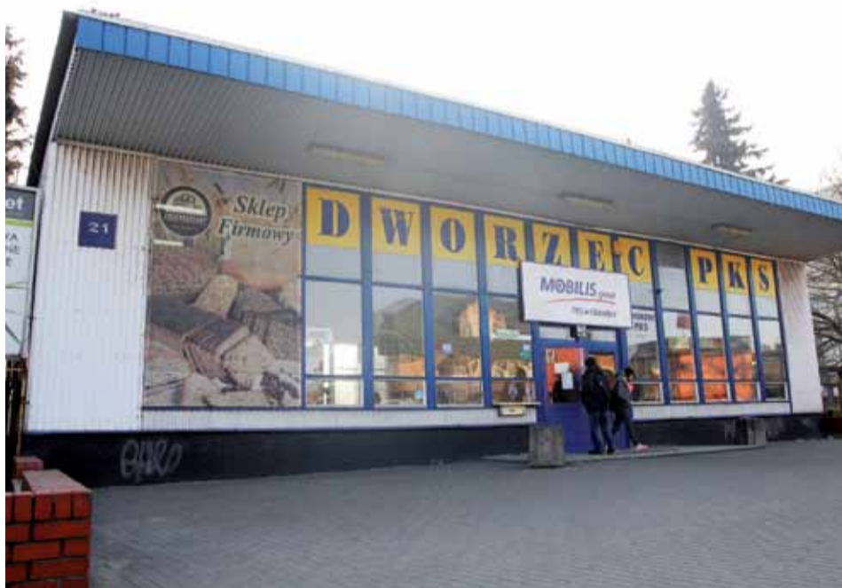
Dzierżawca przez lata nie zrobił nic, by poprawić wygląd dworca

Nowy właściciel przejął nie tylko tabor, ale też wydzierżawił bazę przy ul. Zawadzkiego oraz dworzec przy Bogusławskiego. Wyczekiwanych przez wie-