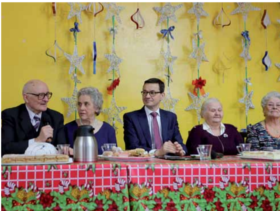
Premier Mateusz Morawiecki niedawno odwiedził ostrołęckich seniorów

Trwają przygotowania do ogłoszenia konkursu na prowadzenie kolejnej takiej placówki, a otrzymane wsparcie zostanie przeznaczone na jej doposażenie. Natomiast bieżąca działalność Dziennego Domu Seniora „Senior+” przy parafii św. Antoniego otrzyma dofinansowanie w wysokości 87 800 złotych. (wd)