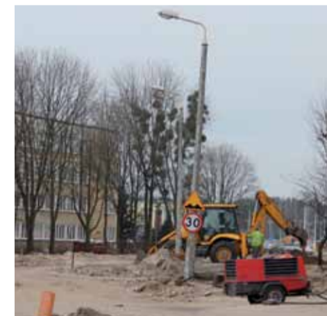
Pogoda sprzyja drogowcom