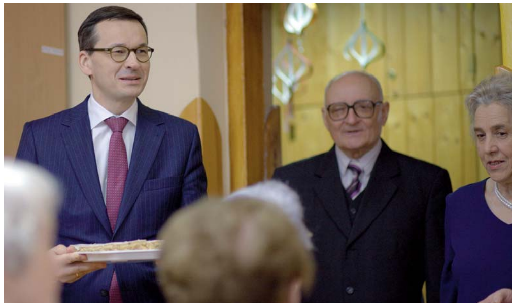
Premier poczęstował seniorów szarlotką