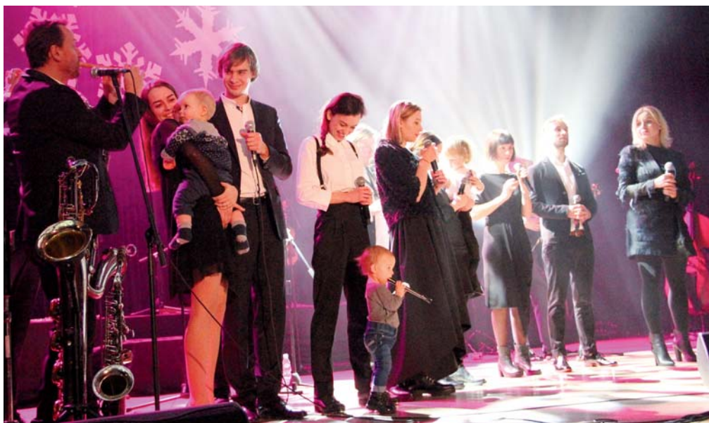
Pasja do muzyki łączy wszystkie pokolenia Pospieszalskich