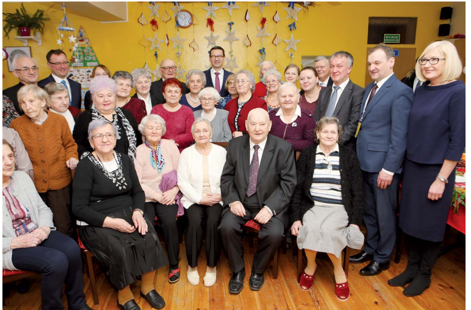
Wspólne zdjęcie z seniorami zakończyło wizytę w DDPS

Ostrołęka była kolejnym punktem na mapie wizyt Prezesa Rady Ministrów. Pobyt w naszym mieście zdominowały sprawy społeczne. Głównym punktem wizyty było spotkanie z osobami starszymi w Dziennym Domu Pobytu Seniora przy kościele pw. Świętego Antoniego. Troska o seniorów ma być kolejnym elementem prospołecznych działań polskiego rządu.