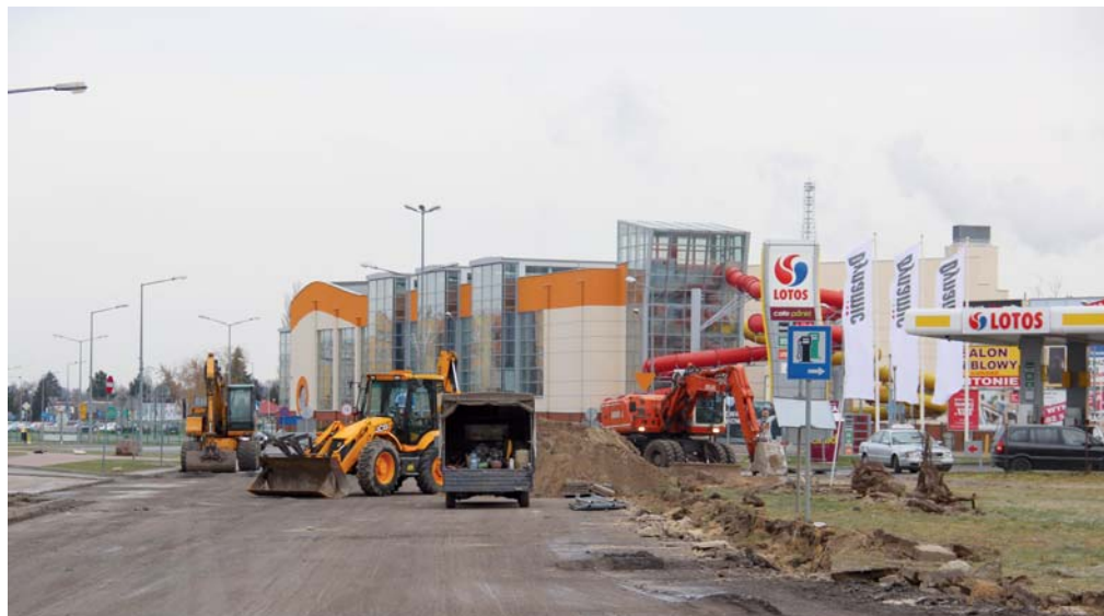
Odcinek ulicy Witosza został sfrezowany

Mimo że wokół nas kalendarzowa zima, to niezbyt niskie temperatury nie przeszkadzają w robotach drogowych przy przebudowie ostrołęckich ulic. Prace ziemne prowadzone są w ulicach Witosza i Dobrzańskiego. Powoli do tej listy dołącza też Ostrowska. Do wszystkich tych inwestycji prezydentowi udało się wywalczyć potężne dofinansowanie sięgające 80% całkowitych kosztów budowy.