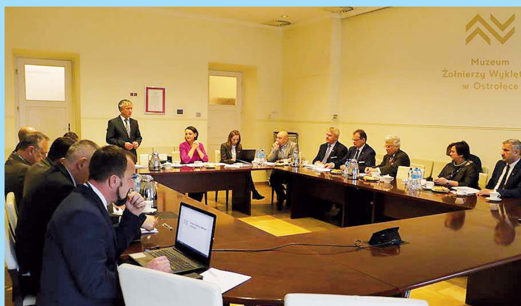
Pierwsze posiedzenie Rady Muzeum Żołnierzy Wyklętych