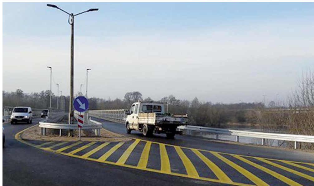
Przeprawa zastępcza już działa