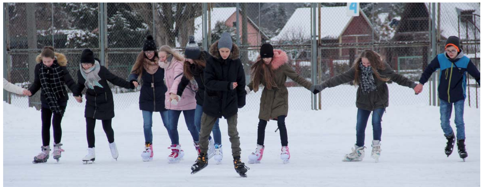
(wd) Miejskie lodowisko cieszy się dużą popularnością

Zimową aurę skwapliwie wykorzystuje miejski organizator zimowego wypoczynku. Miejski Zarząd Obiektów Sportowo-Turystycznych i Infrastruktury Technicznej przygotował lodowisko, cieszące się dużym powodzeniem. Zaplanował też organizację aktywnego wypoczynku dla dzieci i młodzieży w formie kuligu połączonego z ogniskiem. Pierwsze takie spotkanie za nami, dopisała pogoda i humory uczestników. Przed nami kolejne dni ferii i następne propozycje zabawy na świeżym powietrzu – oby tylko zima dotrzymała umówy na dostawę mrozu i śniegu.