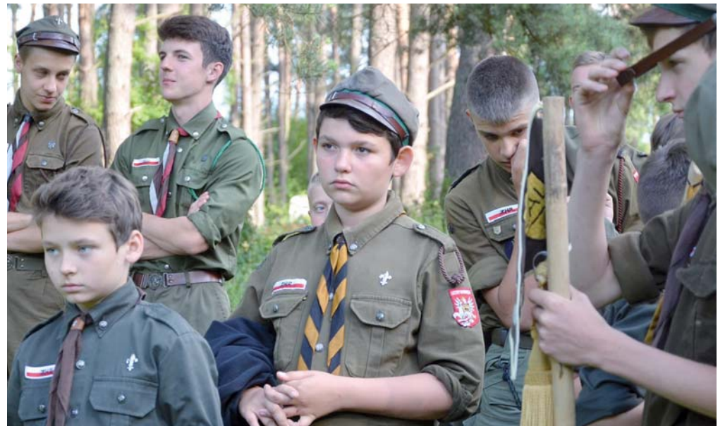
W każdym dziecku jest bohater, wystarczy go obudzić, zainspirować...

W harcerstwie dziecko może być geografem, artystą, inżynierem, animatorem, fotografem, ratownikiem, podróżnikiem, historykiem, menadżerem, kierowcą, spor-