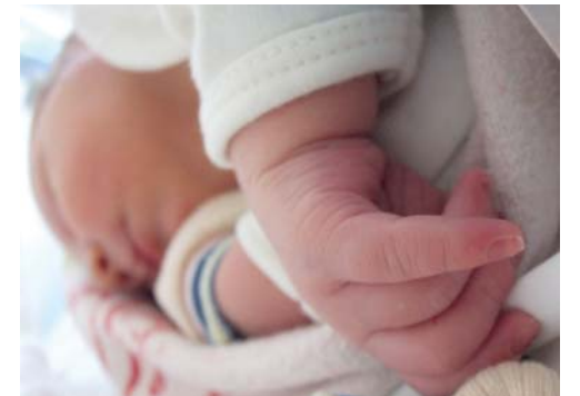
Imionami najczęściej nadawanymi dzieciom w 2017 roku były Jakub i Julia