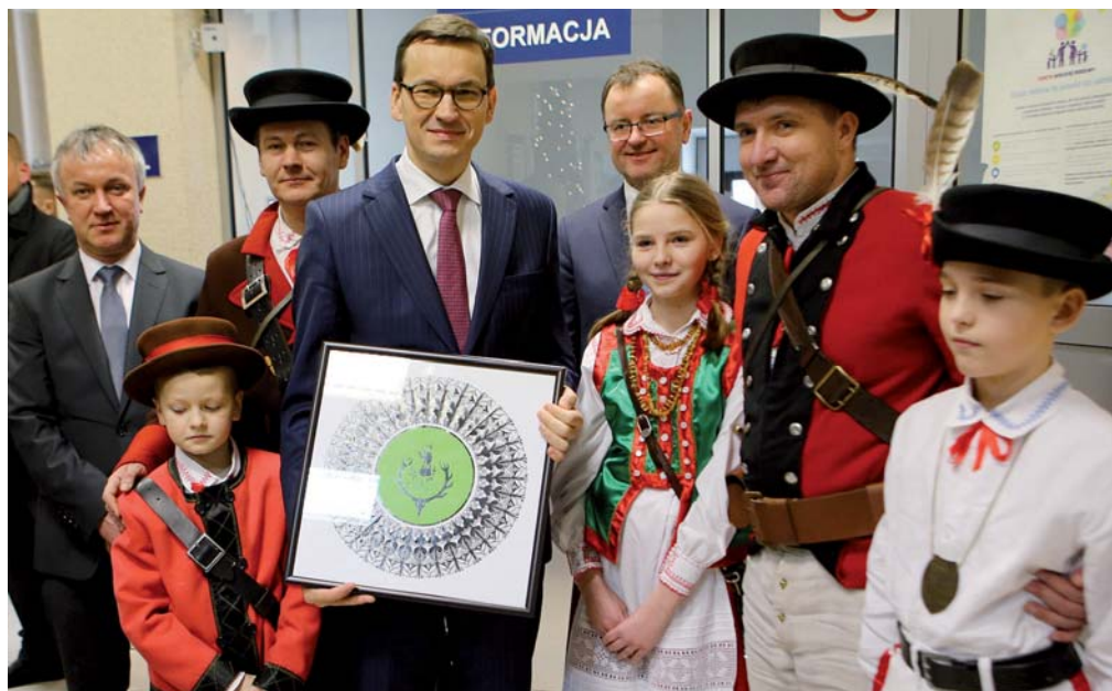
Premier z pamiątkową wycinanką od Strzelców Kurpiowskich

Za swoje wieloletnie wspieranie inicjatywy upamiętnienia ruchu antykomunistycznego i budowy Muzeum Żołnierzy