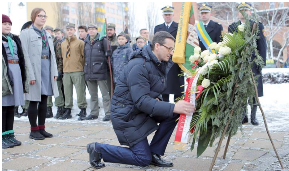
Jednym z punktów wizyty było złożenie kwiatów pod Pomnikiem Ofiar Terroru Komunistycznego