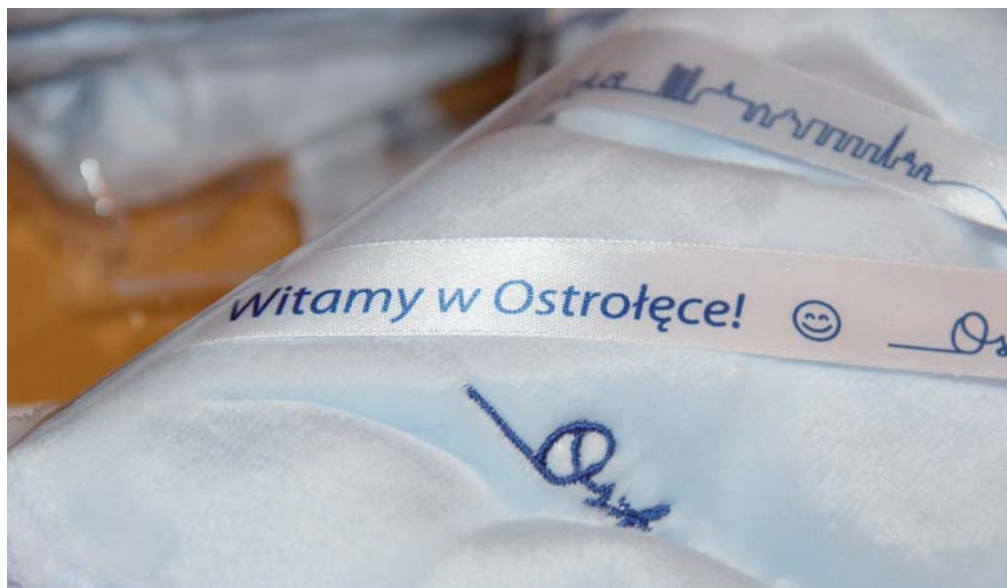
Różowe i niebieskie kocyki czekają na najmłodszych ostrołęczan