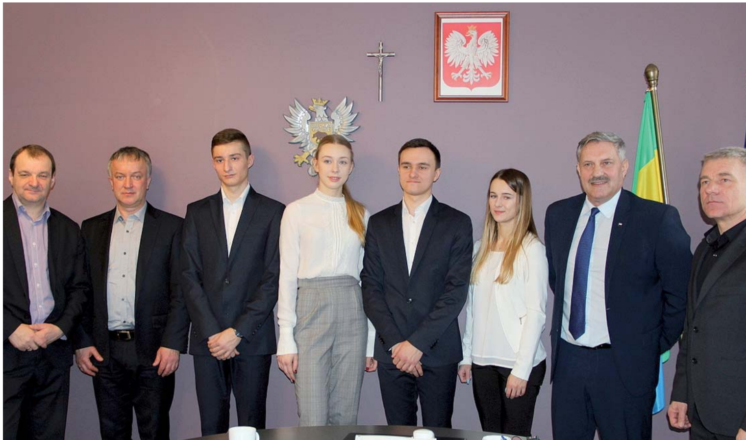
Władze miasta podziękowały lekkoatletom za ubiegłoroczne sukcesy