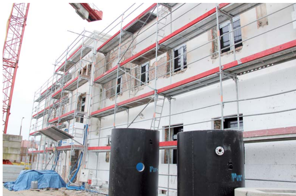
Prace przy budowie muzeum postępują zgodnie z planem