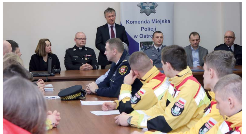
W podpisywaniu porozumienia uczestniczyły władze Miasta Ostrołęki