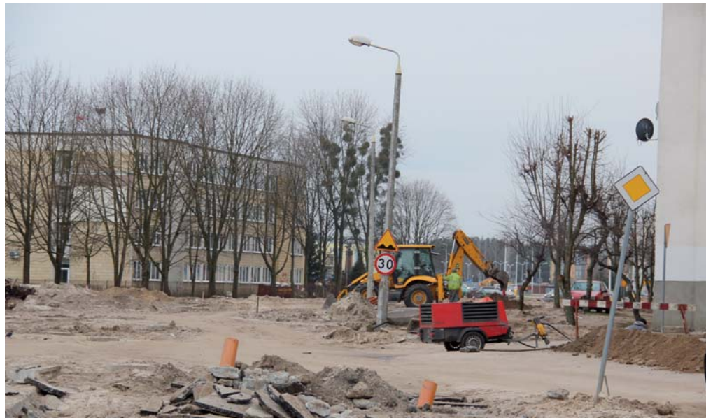
Trwają prace ziemne przy ul. Dobrzańskiego