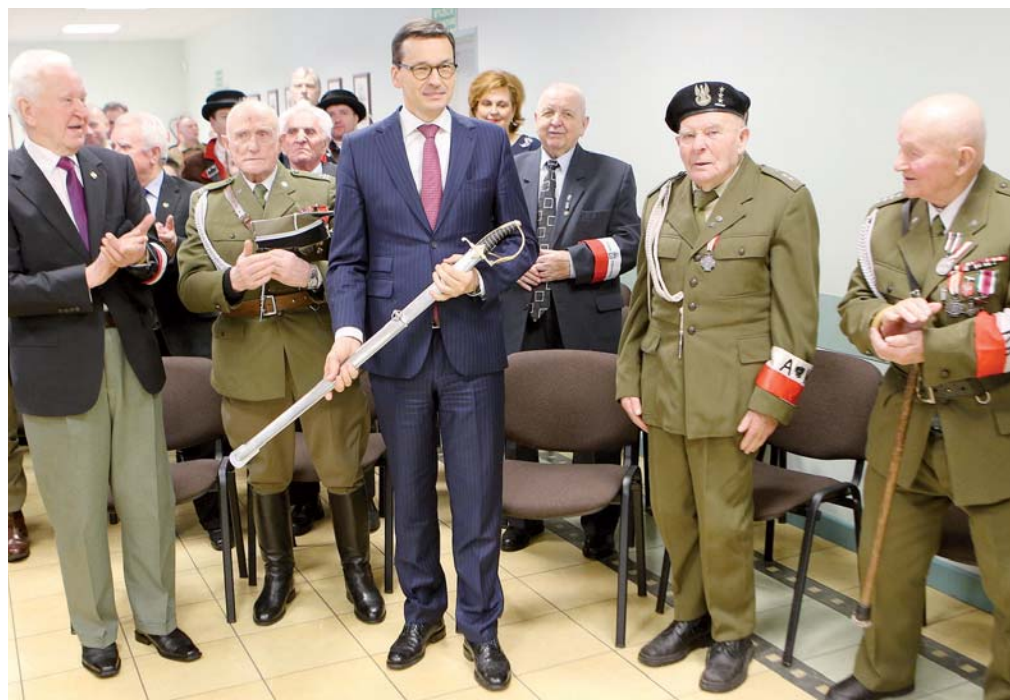
Wśród kombatantów z szablą podarowaną przez prezydenta Janusza Kotowskiego

Wyklętych Mateusz Morawiecki otrzymał gorące podziękowania ze strony Janusza Kotowskiego. Prezydent Ostrołęki wręczył też szefowi rządu szablę, by nadal w bojowym duchu przewodził wprowadzanym reformom. W trakcie krótkiego spotkania w cztery oczy prezydent Ostrołęki poru-