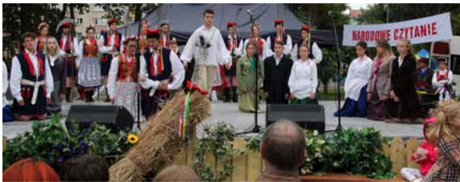
„Wesele” w młodzieżowej obsadzie