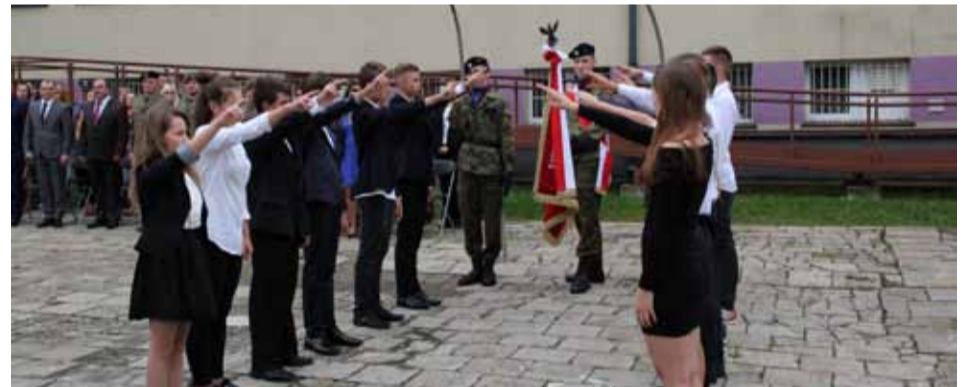
Ślubowanie klas pierwszych w ZSZ nr 2 w Ostrołęce

W ostrołęckich placówkach oświatowych zainaugurowano nowy rok szkolny. Przewodniczący Rady Miasta Jerzy Grabowski i wiceprezydent Grzegorz Płocha spotkali się między innymi z młodzieżą Zespołu Szkół Zawodowych nr 2 im. 5 Pułku Ułanów Zastawskich w Wojciechowicach. Łącznie w szkołach wszystkich szczebli naukę rozpoczęło prawie 9800 uczniów.