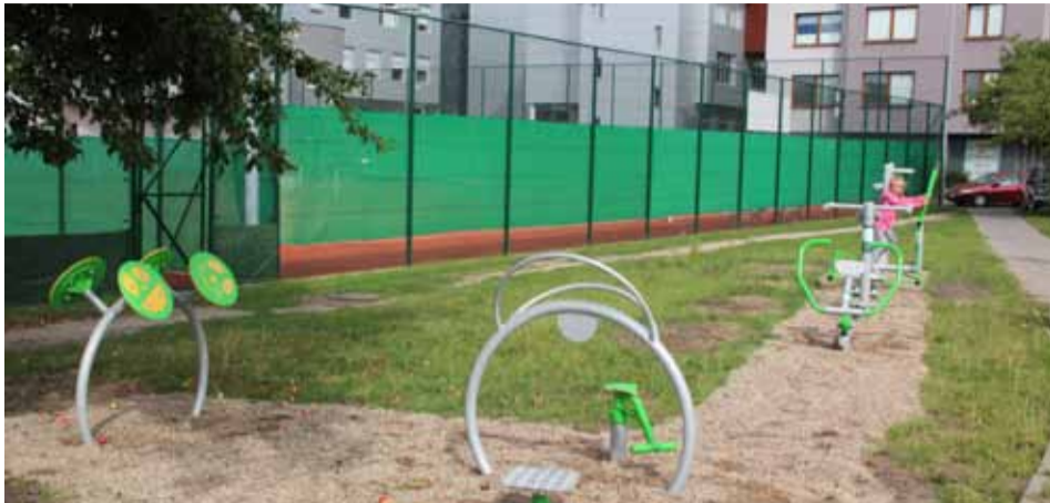
Nowe siłownie zainstalowane zostały m.in. przy ulicy Hallera