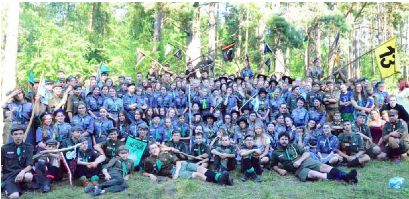
Harcerze z Ostrołęki wypoczywali nad jeziorem Śniardwy