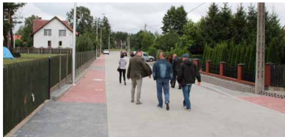
Władze Ostrołęki intensywnie poprawiają infrastrukturę w mieście

Oficjalnie oddano do użytku ulicę Ordona na osiedlu Łazek. Wartość inwestycji wyniosła blisko 1 milion 170 tysięcy złotych.