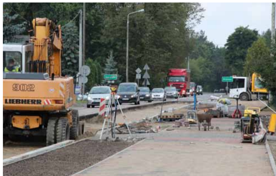
Już w październiku ul. Brzozowa zostanie całkowicie zmodernizowana

Trwa przebudowa drogi wojewódzkiej nr 544 w odcinku ulicy Brzozowej na terenie miasta Ostrołęki. Samorząd pozyskał na ten cel ponad 1 mln zł. Wkład własny wynosi ok. 200 tys. zł