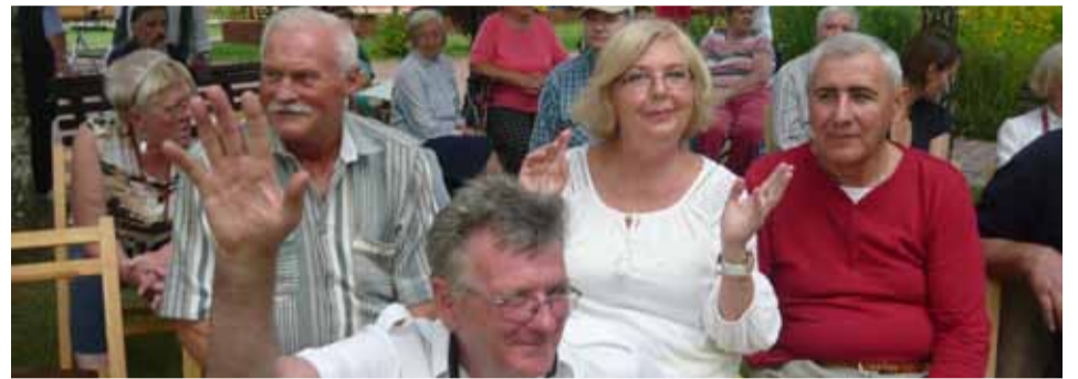
Ostrołęccy seniorzy po raz kolejny odwiedzili DPS