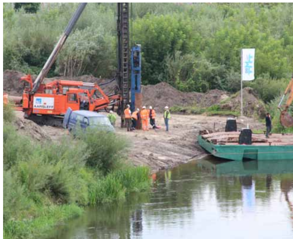
Maszyna zaraz po przewiezieniu na plac budowy rozpoczęła pracę

- Mamy też wiele pytań o to, dlaczego wybrano takie usytuowanie przeprawy zastępczej, a nie wybudowano mostu np. na zjeździe