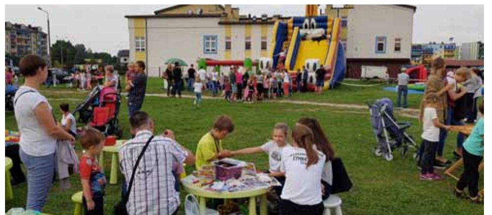
Większość z atrakcji skierowana była do najmłodszych mieszkańców osiedla