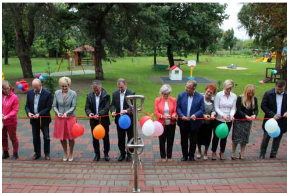
Uroczyste otwarcie zmodernizowanego placu zabaw