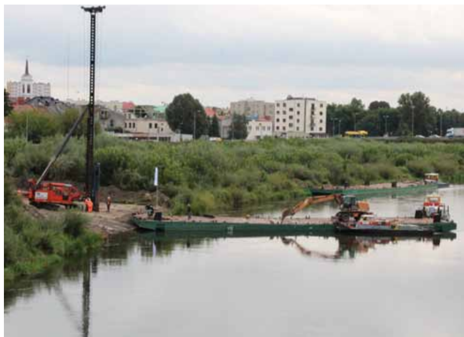
Wbijanie pali jest jednym z elementów przygotowania terenu pod budowę tymczasowej przeprawy

przekroczeniach drgań. Są one między innymi przymocowane do kościoła farnego.