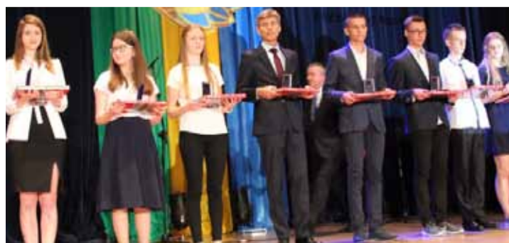
Samorząd nagrodił młodych, wszechstronnie utalentowanych Ostrołęczan