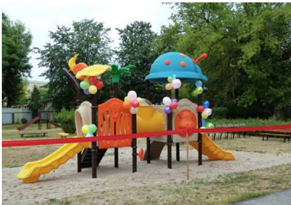
Jedną z nowych atrakcji jest zjeżdżalnia

placem zabaw, wyposażonym w atrakcyjne i bezpieczne urządzenia. Jest wielofunkcyjna zjeżdżalnia, nowe huśtawki, karuzela i bujaki. Wykonawcą prac i zarazem producentem zabawek wyłonionym w procesie przetargowym była firma dr Spil Polska z Katowic. Kolejne