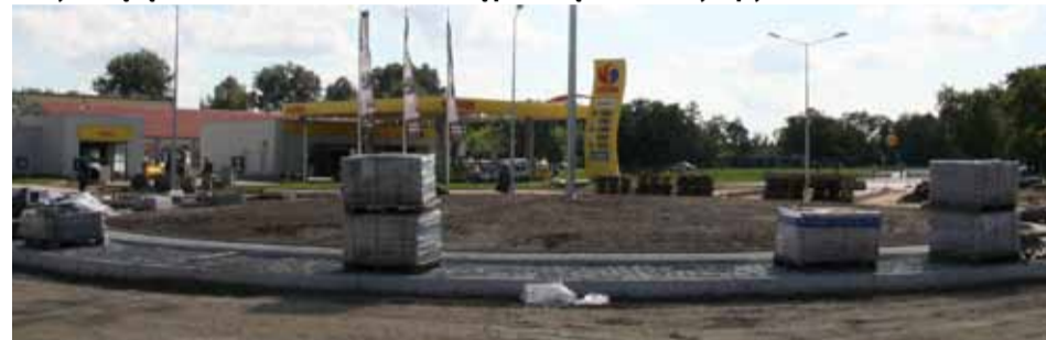
Ulica Witosy już niebawem na całej swojej długości będzie zmodernizowana

Miasto ogłosiło przetarg na przebudowę odcinka ulicy Witosy od ronda im. Zofii Niedziałkowskiej do ronda im. Holgera Hjelma. Tym samym dwupasmową ulicą zostaną połączone odcinki drogi wojewódzkiej nr 627, a kierowcy nie będą wreszcie narzekać na nawierzchnię położoną na betonowych płytach.