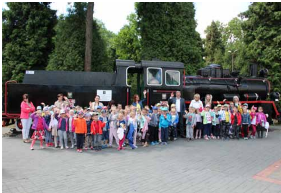
Grupowe zdjęcie przy lokomotywie podsumowało wizytę na Stacji

Grupa przedszkolaków z PM nr 16 „Kraina Odkrywców” odwiedziła dworzec PKP. Wśród atrakcji była między innymi wizyta w „Kasie biletowej Jerzego Grabowskiego”, zwiedzanie parowozu i widok na stację z kładki nad torami.