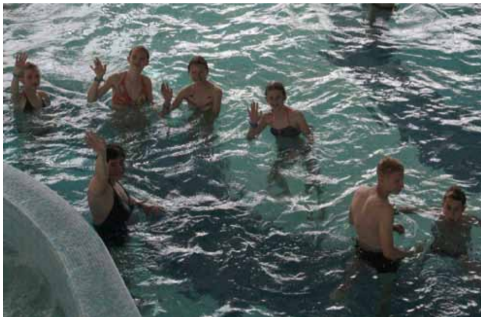
Jedną z atrakcji dla dzieci z Pińska był pobyt na ostrołęckiej pływalni