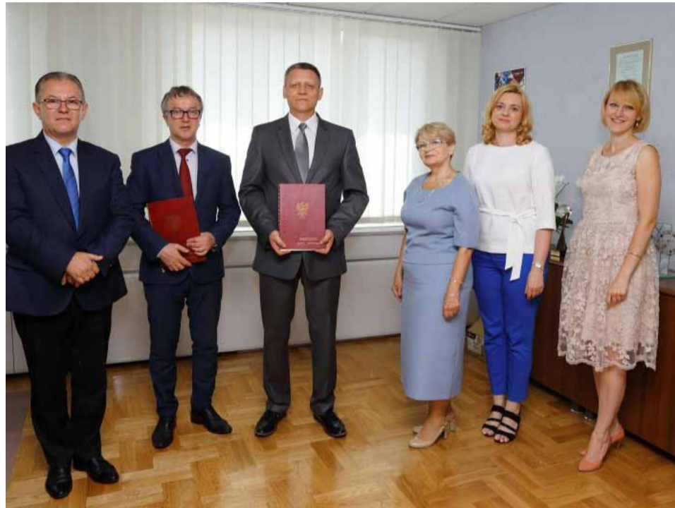
Umowę podpisano w siedzibie Energi

cyjnym pracodawcą poprawia jakość i efektywność kształcenia między innymi poprzez tworzenie i rozwijanie rozwiązań systemowych w praktyce nauki zawodu prowadzonej w ścisłej współpracy z lokalnymi przedsiębiorstwami. Takie działania pozwalają tym samym