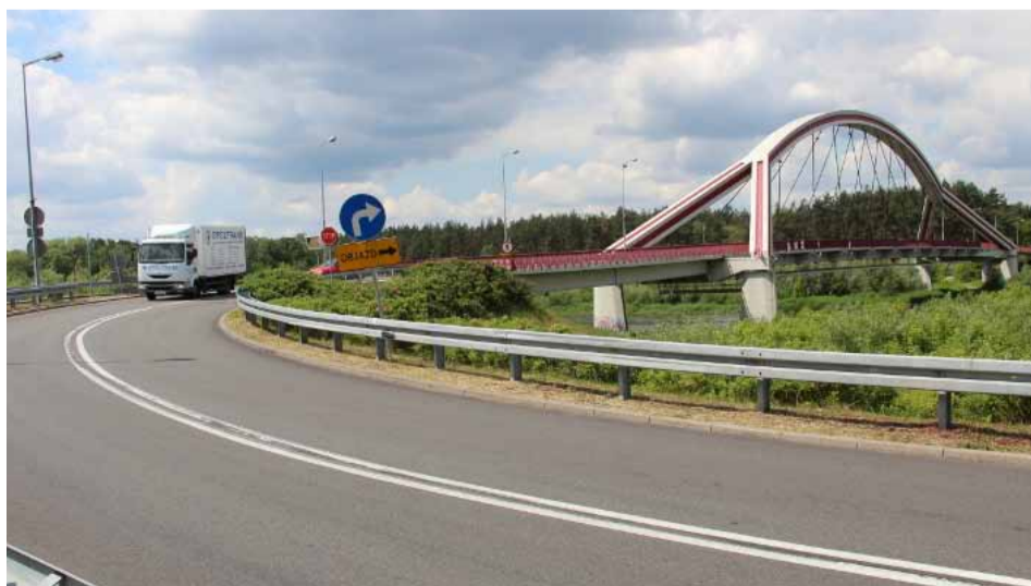
Ostrołęckie ciężarówki nadal będą mogły przeprawiać się przez „nowy” most