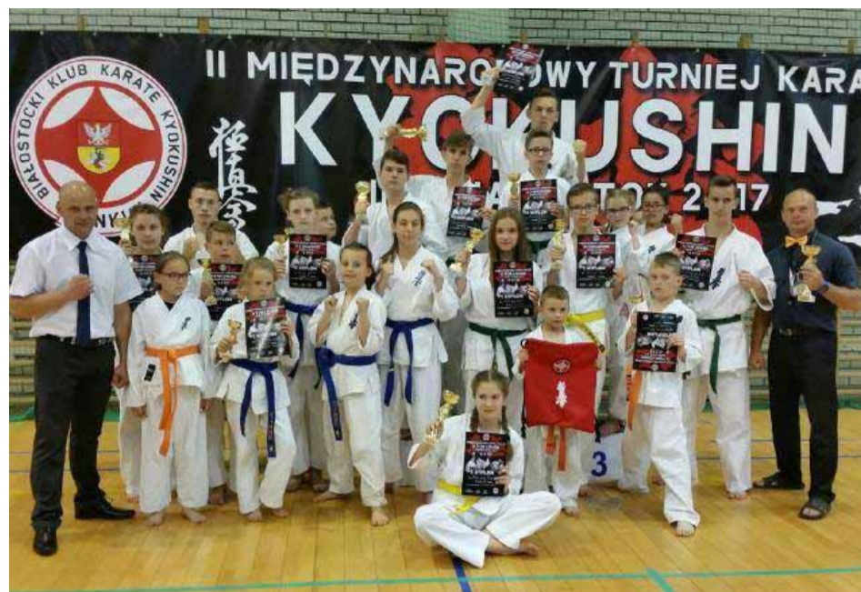
Ekipa Ostrołęckiego Klubu Karate Kyokushin

10 czerwca drużyna OKKK gościła w Białymstoku, gdzie odbył się Międzynarodowy Turniej w Karate Kyokushin. W zmaganiach udział wzięło ponad 200 zawodników z czterech państw: Polski, Białorusi, Rosji i Mołdawii.