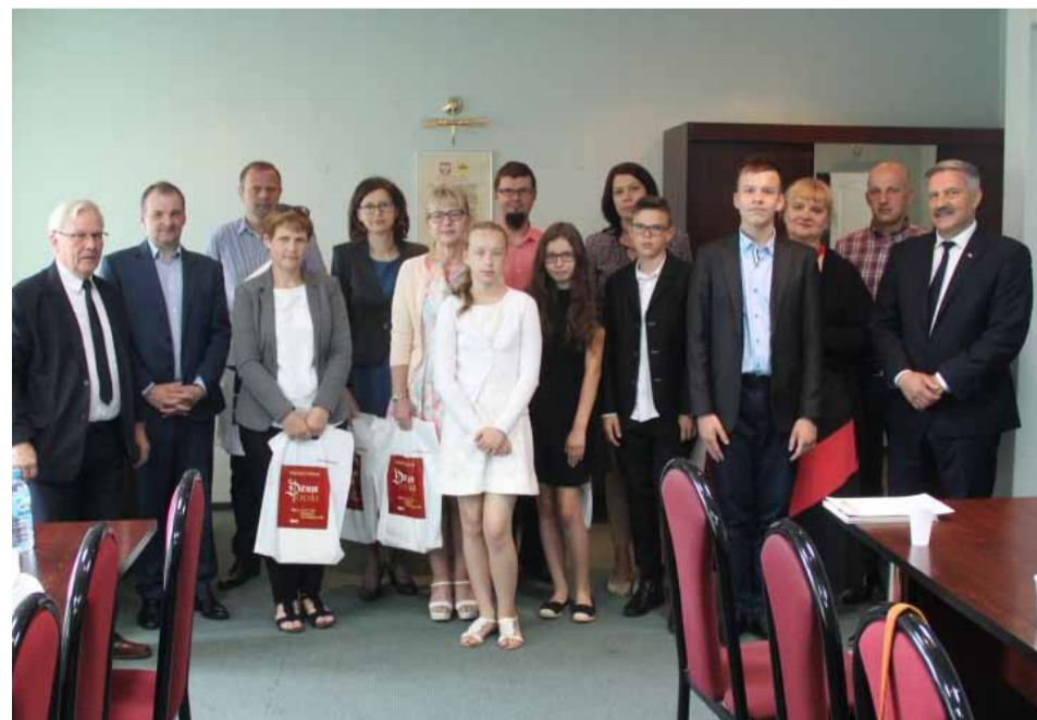
Nagrody wręczono laureatom w Urzędzie Miasta