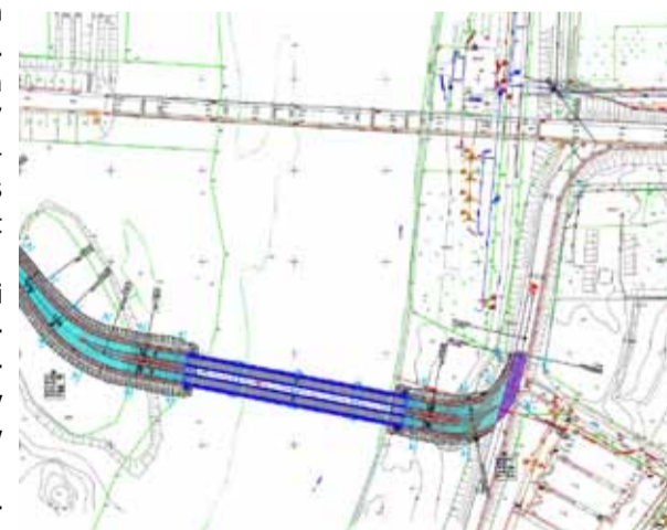
Planowana przeprawa będzie wiodła ulicą Spacerową

dla filarów w postaci pali z rur stalowych pod tymczasową przeprawę mostową, na czas rozbudowy istniejącego mostu na rzece Narew w ciągu drogi krajowej nr 61 wraz z dojazdami, w ramach zadania inwestycyjnego pn. „Rozbudowa mostu na rzece Narew w Ostrołęce w ciągu drogi krajowej nr 61, ul. Mostowa, Ostrołęka. Ze względu na zły stan techniczny istniejącego mostu stałego w ciągu drogi krajowej nr 61 (ul. Mostowa) zostanie on rozebrany, a następnie odbudowany w miejscu istniejącego. Na czas rozbudowy istniejącego mostu niezbędnym jest wybudowanie drogi objazdowej dla wyłączonego z ruchu obiektu. W ramach inwestycji zaplanowano budowę tymczasowego obiektu mostowego złożonego z dwóch obiektów (po jednym dla każdego z kierunków ruchu) o konstrukcji DMS-65. Zaplanowano drogi dojazdowe do przeprawy tymczasowej o nawierzchni asfaltowej, szerokości jezdni min. 6,5 m wraz z pobocznymi o szer. 1,25-2,3 m. Długość łączna dróg dojazdowych do przepra-