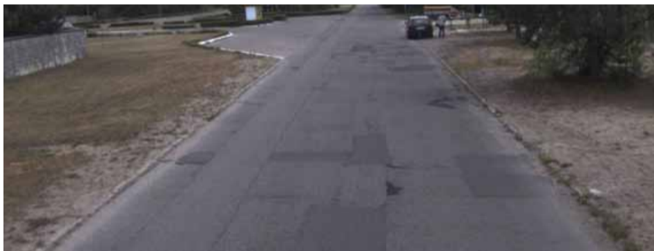
Krańcowa niebawem zmieni wygląd