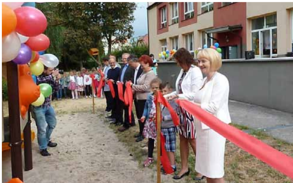
Otwarcie zmodernizowanego placu zabaw

Przypomnijmy, że w głosowaniu mieszkańców propozycja ta zdobyła drugą w kolejności ilość głosów (1574) w ubiegłorocznym plebiscycie. Jej wartość zamknęła się kwotą blisko 50 tysięcy złotych i już od dziś oficjalnie przedszkolaki mogą się cieszyć nowym