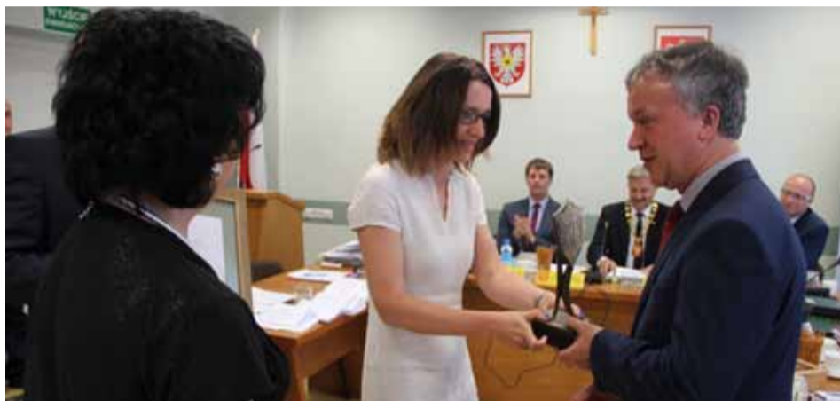
Prezydent Ostrołęki wyróżnienie otrzymał z rąk przedstawicieli OSM i SM „Centrum”

W zakresie gospodarki nieruchomościami dzięki dobrej współpracy nastąpiło przekształcenie na preferencyjnych warunkach prawa wieczystego użytkowania w