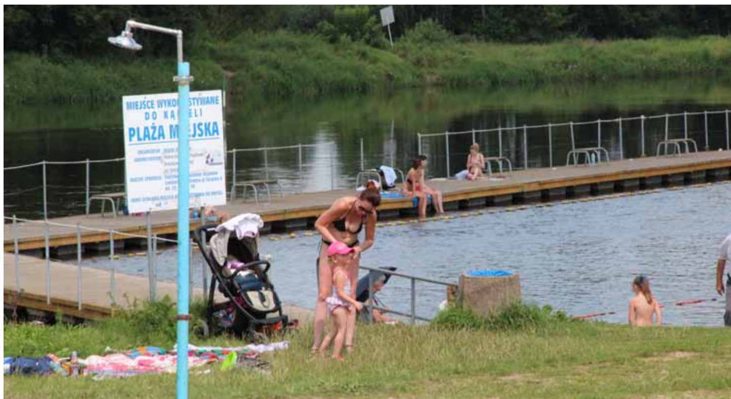
Narew bezpieczna dla kąpiących się