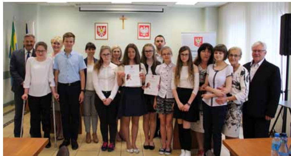
Laureaci papieskiego konkursu

Poznaliśmy laureatów konkursu wiedzy o papieżu, Świętym Janie Pawle II. Młodzież szkół podstawowych, gimnazjów i szkół ponadgimnazjalnych już po raz piąty rywalizowała o miano najlepszego znawcy Patrona Ostrołęki.