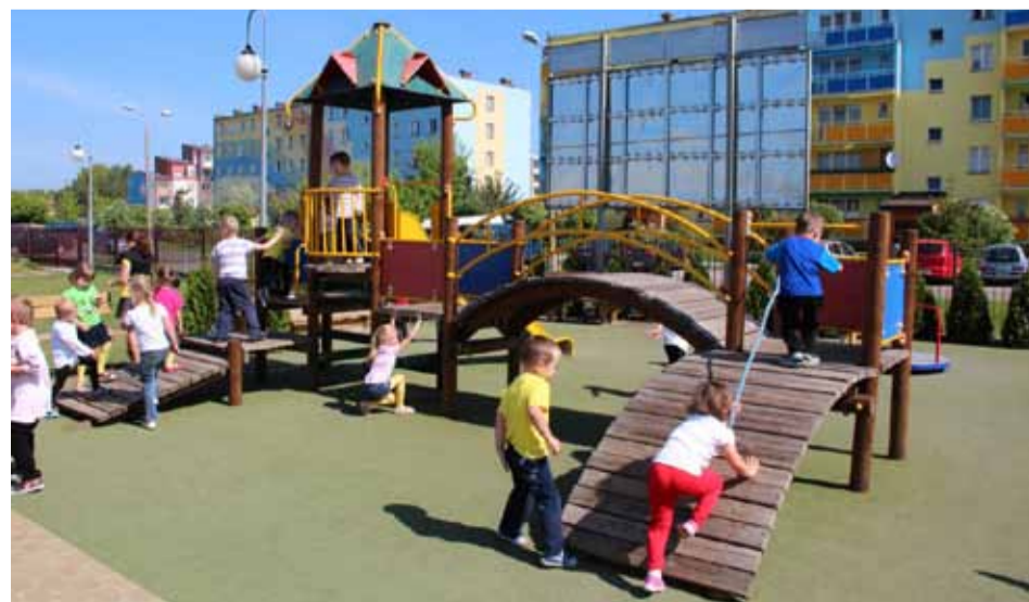
Dzięki decyzji Prezydenta Miasta przedszkola w tym roku przyjmą wszystkie chętne dzieci

Dodatkowe oddziały powstaną w Przedszkolu Miejskim nr 9. Zostanie do nich przyjętych pięćdziesięcioro troje dzieci, dla których wcześniej zabrakło miejsca w procesie rekrutacji do samorządowych placówek.