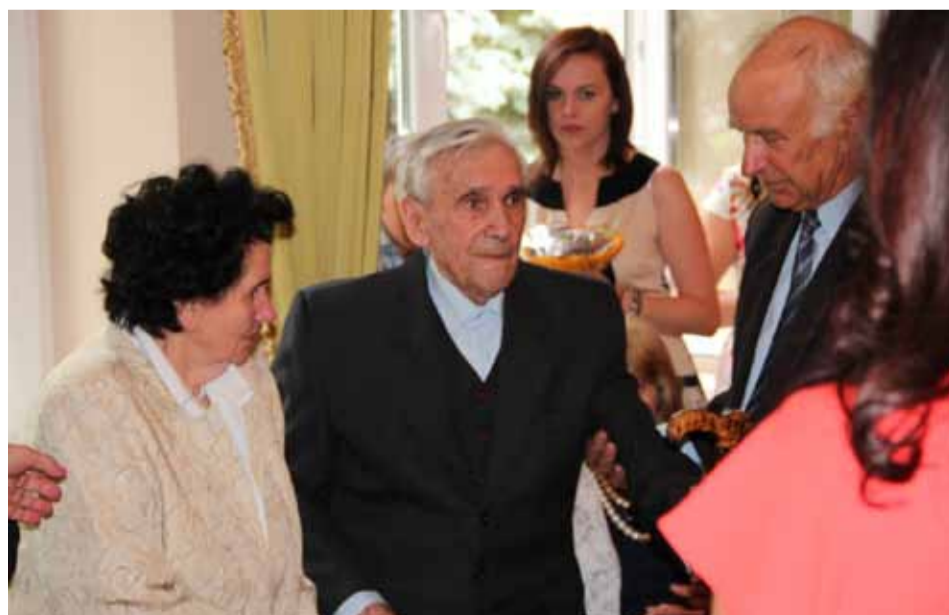
Kolejne grono jubilatów zostało odznaczonych medalem za długoletnie pożycie małżeńskie