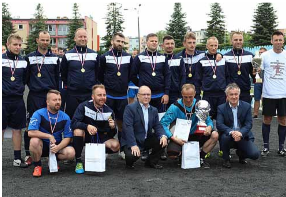
Zwycięska ekipa Podkarpacia

Przed finałowym spotkaniem turnieju rozegrano mecz towarzyski