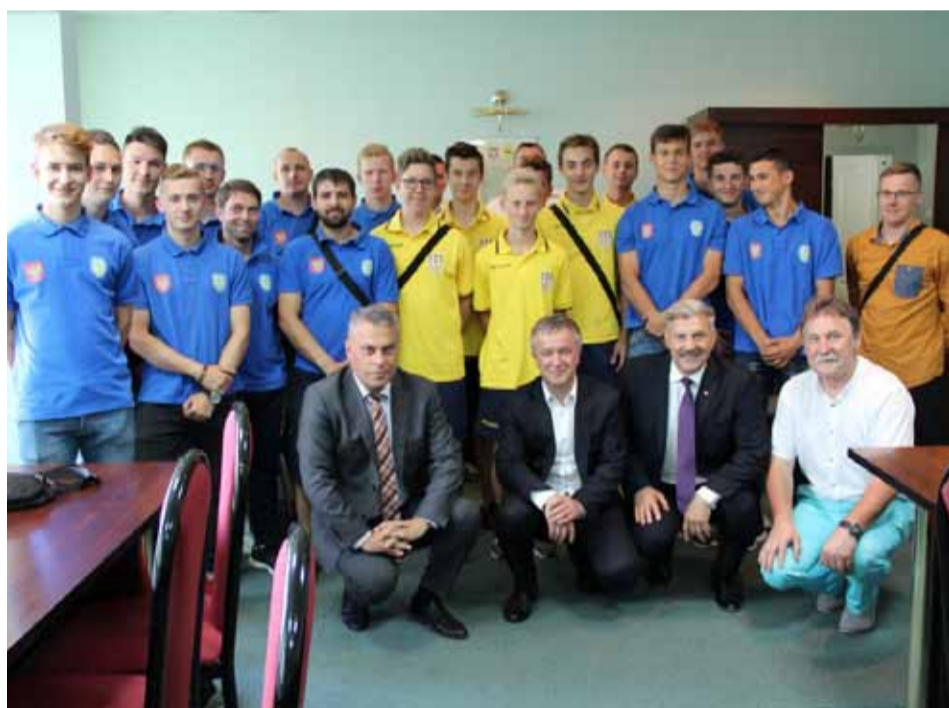
Zawodnicy Korony po niezwykle udanym sezonie