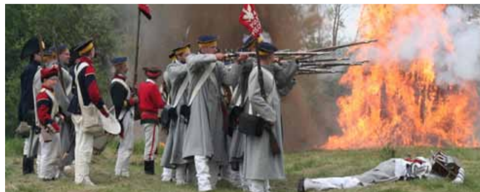
Rekonstrukcja bitwy pod Ostrołęką z 2011 r.

Korzystając z przewagi liczebnej, Rosjanie zmusili Francuzów do wycofania się do miasta. Ofensywa rosyjska została jednak na tym zatrzymana. Broniącym się z niezwykłą odwagą żołnierzom napoleońskim udało się odeprzeć dwa ataki Rosjan. W czasie jednego z nich poległ doceniany przez Napoleona generał Francois Frederic Campagna. Około południa siły francuskie wzmocniła dywizja grenadierów, której dowodził słynący z odwagi gen. Charles Oudinot.