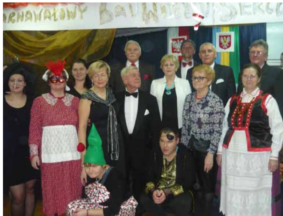
Członkowie Rady Seniorów z wizytą w DPS

28 stycznia odbyło się spotkanie Rady Seniorów w Ostrołęce z dyrekcją DPS na ulicy Rolnej oraz jego mieszkańcami. Radę Seniorów reprezentował Zarząd oraz Koordynatorzy Zespołów Rady.