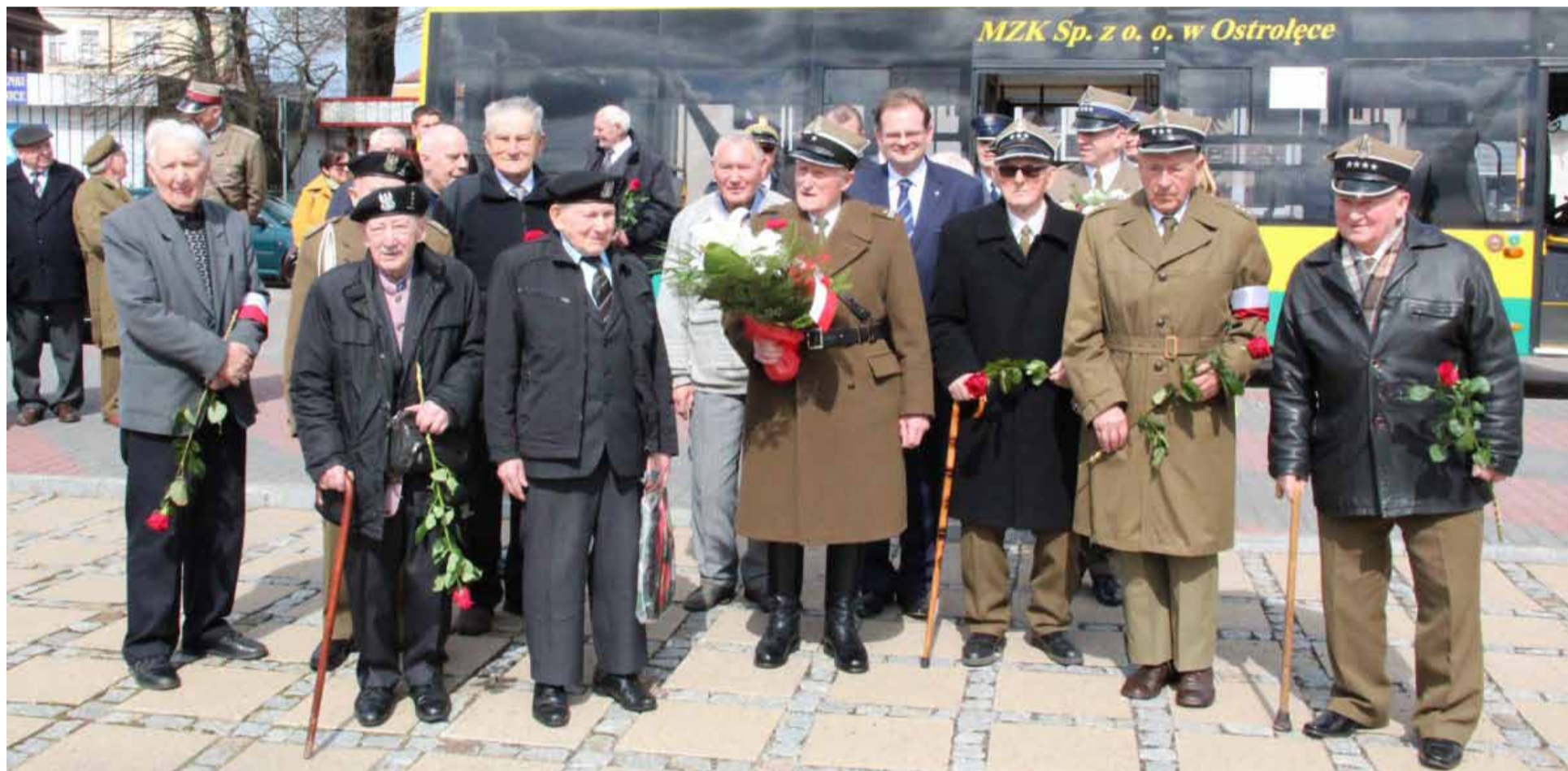
Ostrołęccy weterani Armii Krajowej