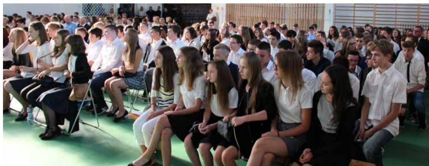
Prezydentowi zależy żeby uczniowie znaleźli w ostrołęckich placówkach jak najlepsze warunki rozwoju

W Ostrołęce już przystąpiliśmy do realizacji nowych zadań. Samorządowcy, nauczyciele, pracownicy szkół i przedszkoli, wreszcie rodzice i inne osoby związane z ostrołęcką oświatą z pewnością różnią się swoim szczegółowym spojrzeniem na założenia reformy, niektórzy zapewne są jej przeciwni. Ale skoro decyzje zapadły, wyjątkowo ważne jest to, byśmy wspólnie przeprowadzili wszystko, co do nas należy.