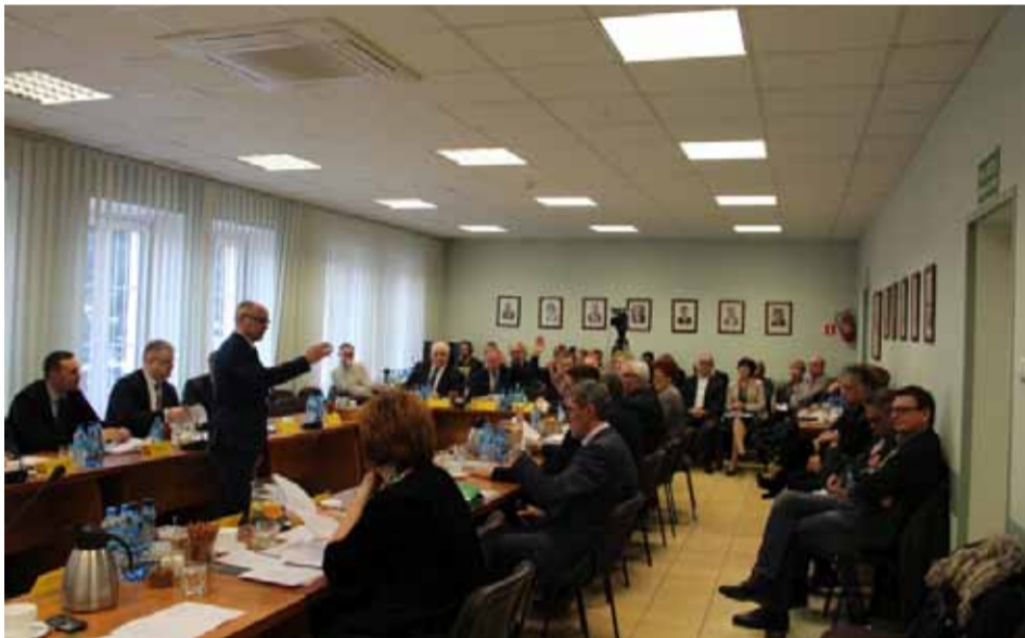
Rada Miasta zdecydowała o o emisji obligacji