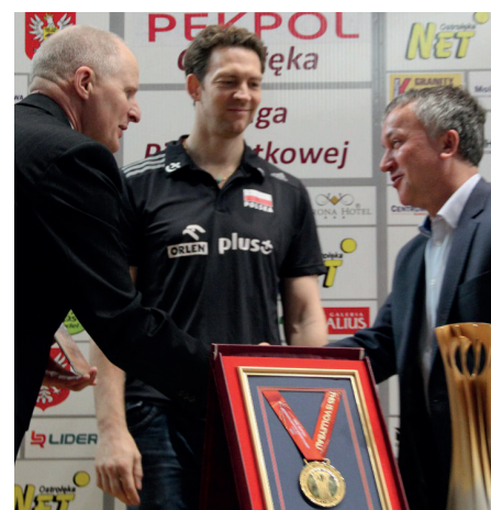
Stephane Antiga prezentuje trofea polskiej reprezentacji

Na koniec wszyscy uczestnicy spotkania mogli sobie zrobić wspólne zdjęcie z Stephanem Antigą, trenerem najlepszej na świecie drużyny siatkarskiej.