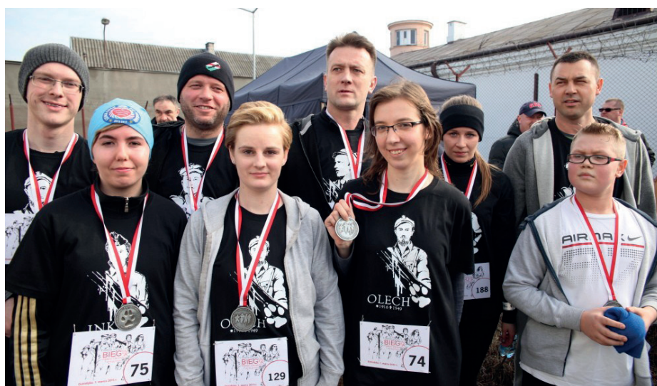
Uczestnicy biegu Tropem Wilczym

Msza święta, koncerty muzyczne, bieg pamięci, spotkania w szkołach i na uroczystości miejskiej – w tych wszystkich formach ostrołęczanie włączali się w przywracanie pamięci o polskich bohaterach. Ci, których wspominamy, to nie jakieś abstrakcyjne postaci, to młodzi, wspaniali ludzie, którzy zdali egzamin z honoru i miłości do Ojczyzny w dramatycznym czasie powojennym. Pozostali wierni przysiędze i marzeniom o Polsce wolnej od faszystowskiego czy komunistycznego najeźdźcy. Pamięć o nich to nie jakiś napuszony uroczysty dodatek do naszej codzienności. Oni oddali życie w słusznej sprawie. Chcemy i powinniśmy o nich pamiętać.