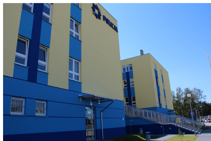
Nowa komenda przy ulicy Korczaka