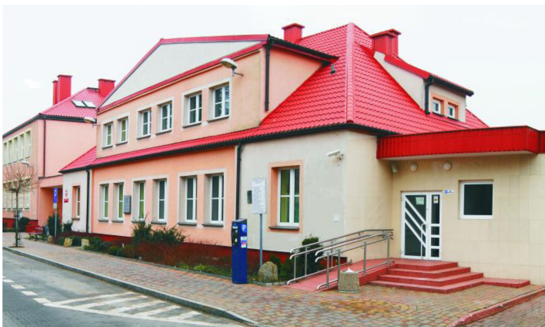
Aktualna siedziba Sądu Okręgowego

dliwości na szczeblu okręgowym, prezydent wyraził wstępną gotowość do przekazania działki Ministerstwu Sprawiedliwości.