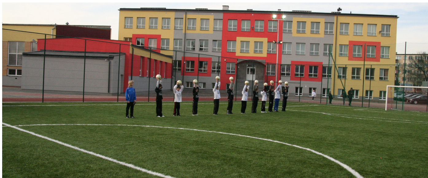
Tak wygląda SP nr 6 im. Orła Białego po termomodernizacji i wybudowaniu Orlika

Udało nam się zmodernizować większość budynków szkół i przedszkoli. Przy większości podstawówek powstały place zabaw i „Orliki”