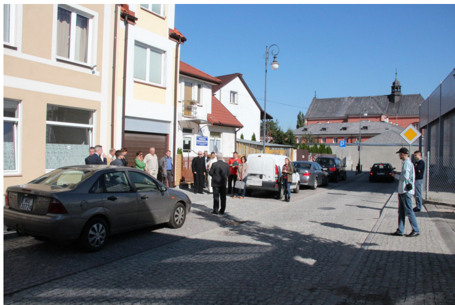
Ulica Bernardyńska odzyskała staromiejski charakter

nię w formie ciągu pieszo – jezdnego, umożliwiającego swobodne omińnięcie zaparkowanego pojazdu. Powstała też nowa kanalizacja deszczowa o długości 50 metrów i postawiono nowe latarnie. Wykonawcą wartęj ponad 200 tysięcy