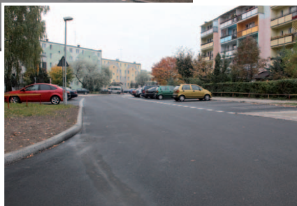
Ulica Kleeberga po remoncie

wano zatoki postojowe. Wykonano też regulację wysokościową kraterk ściekowych oraz wymianę włazów rewizyjnych i połączeniowych wraz z zabudową pierścieni odciążających. Ulice zostały okrawężnikowane, po czym na nowej podbudowie z kruszywa ułożono asfaltowe nawierzchnie jezdni. Poprawiono