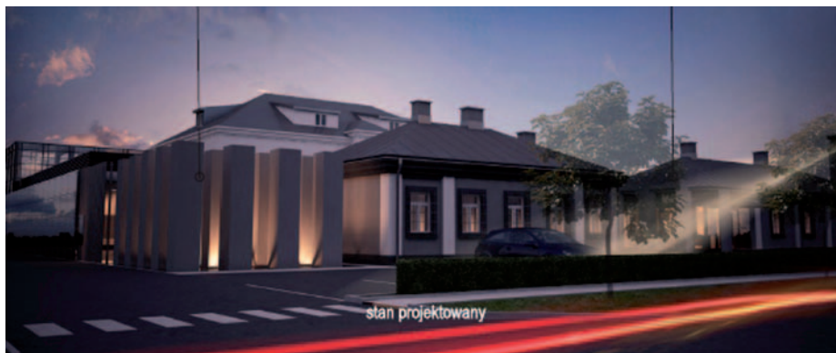
Wizualizacja Muzeum Żołnierzy Wyklętych przy ulicy Traugutta

Więcej dyskusji wzbudził pomysł budowy Muzeum Żołnierzy Wyklętych