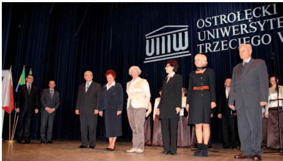
Uczestnicy Uniwersytetu III Wieku