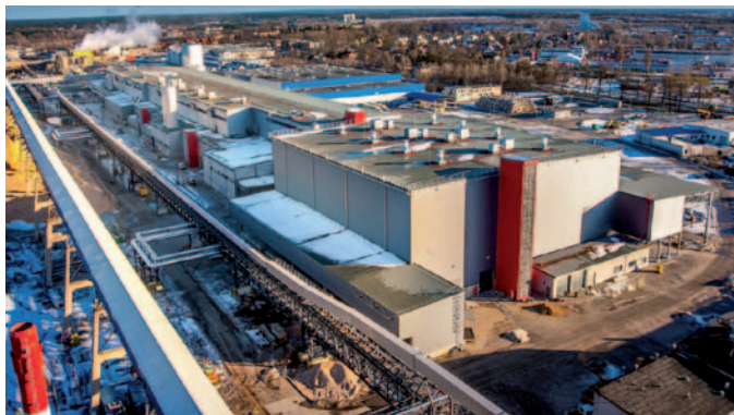
Nowa maszyna papiernicza Stora Enso Poland w Ostrołęce

ców, a jednocześnie gwarantuje stabilny wpływ podatków do miejskiej kasy. Nie najgorzej wygląda też sytuacja związana z pozyskiwaniem unijnych środków przez samorząd i jego jednostki. Tylko w ostatnich dwóch latach uzyskaliśmy wielomilionowe wsparcie na projekty