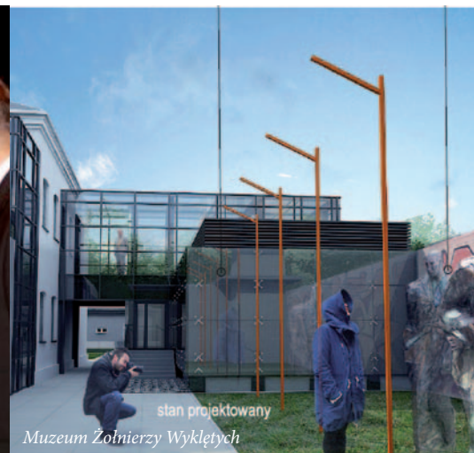
stan projektowany Muzeum Żołnierzy Wyklętych