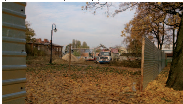
Plac budowy przy ul. Braterstwa Broni

Wykonawcą inwestycji, wyłonionym w postępowaniu przetargowym, jest Ostrołęckie Przedsiębiorstwo Realizacji Inwestycji.