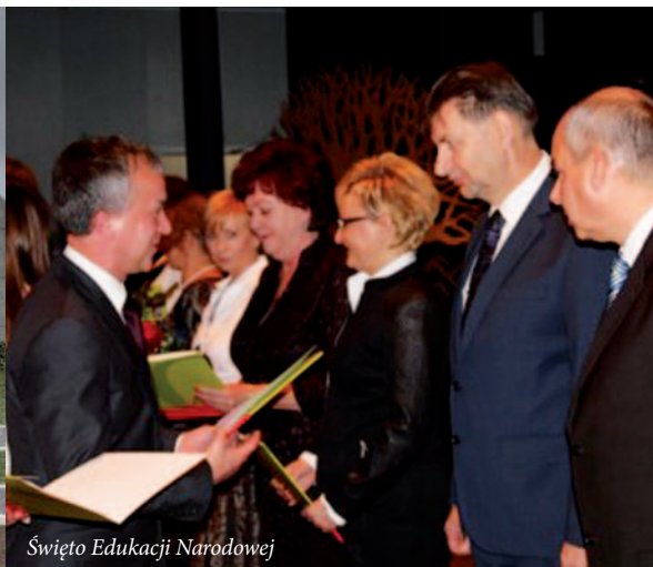
Święto Edukacji Narodowej