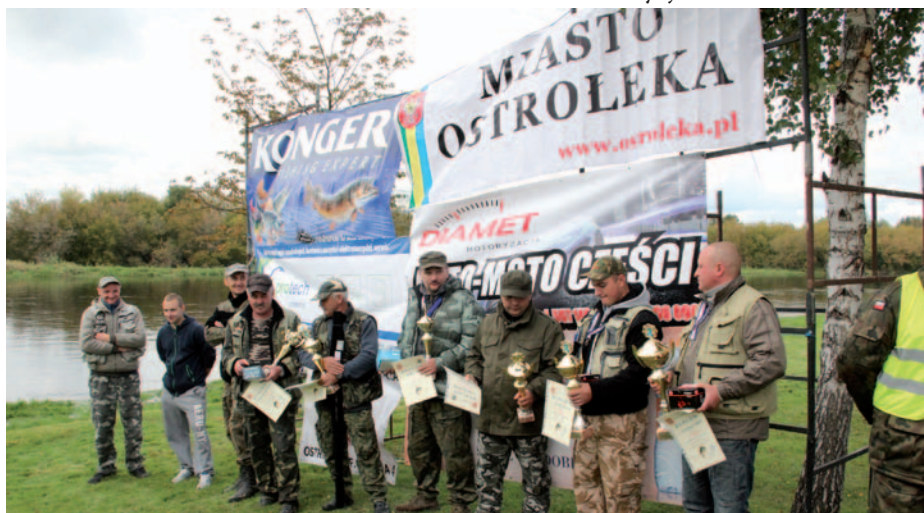
Zwycięzcy zawodów spinningowych

rego mostu. Niestety nie udało się złowić żadnego szczupaka, a szczęśliwi wędkarze musieli zadowolić się połowem okoni. Zwycięzcom gratulujemy, a wszystkim uczestnikom życzymy sukcesów w III edycji Pucharu.