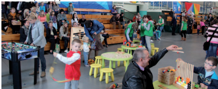
W grach i zabawach wzięły udział całe rodziny

rozgrzewający i smaczny bigos. Hala im. Arkadiusza Gołasia na jeden dzień zamieniła się w duży plac zabaw. Warto