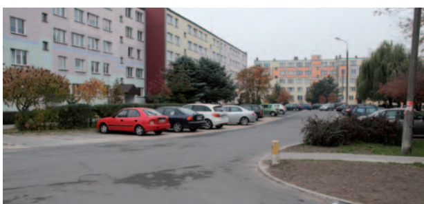
Wyremontowana ulica Dzieci Polskich

Wykonawcą robót w przypadku obydwóch inwestycji była firma MAKBUD z Łomży, będąca oddziałem spółki UNIBEP z Bielska Podlaskiego. W ramach robót rozebrano stare nawierzchnie i wyfrezo-