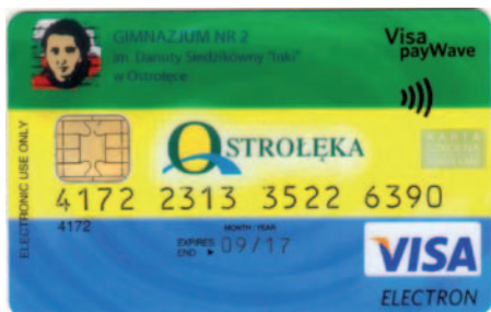
Wzór karty szkolnej z Gimnazjum Nr 2

„Bezpieczna Szkoła” to nazwa projektu, który realizuje z miastem Bank Zachodni WBK. Zakłada on współpracę na dwóch płaszczyznach – poszerzenia zakresu bezpieczeństwa ucznia przez wyposażenie placówek w system kontroli dostępu powiązany z programem Edukacji Ekonomicznej oferowanej przez Bank Zachodni WBK S.A.