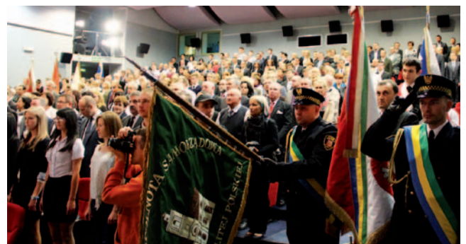
Blisko 400 ostrołeczian uczestniczyło w sesji poświęconej dr. Psarskiemu

śława Parzycha. W trakcie sesji uczniowie Zespołu Szkół Zawodowych nr 1 wystąpili w przedstawieniu „Sąd nad latarnikiem” opartym na motywach sienkiewiczowskiej noweli.