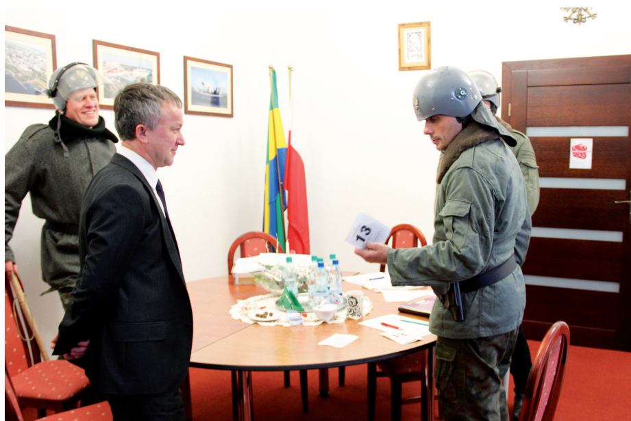
Prezydent w trakcie „przesłuchania”

z nas niezwykle ciekawa lekcja historii. Gratulujemy pomysłodawcom.