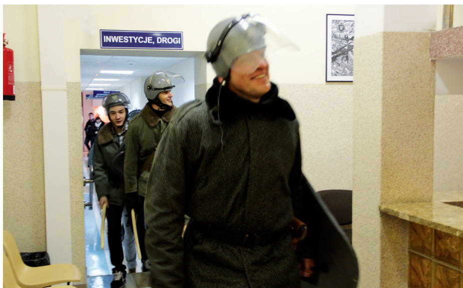
Uczniowie i nauczyciele ZSZ Nr 1 wcieliłi się w funkcjonariuszy Milicji Obywatelskiej

Z interesującą inicjatywą wystąpiła społeczność ZSZ nr 1 w Ostrołęce. Uczniowie i nauczyciele odegrali żywą inscenizację przypominającą wydarzenia z roku 1981. Byli milicjanci z pałkami, niebieska nyska z napisem MO, ulotki, pościgi, „koksownicy”. To była dla wielu