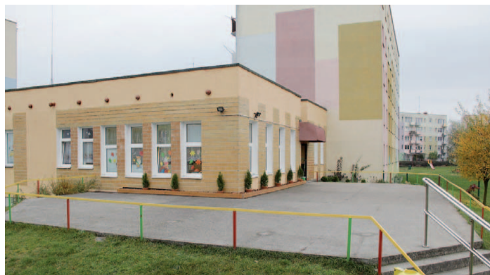
Taras przy Przedszkolu nr 1 zostanie zmieniony w nowoczesne miejsce zabaw dla dzieci

W tym roku do Urzędu Miasta wpłynęło 16 propozycji zadań Budżetu Obywatelskiego. Do dalszego etapu komisja zakwalifikowała 12 propozycji – 5 dla