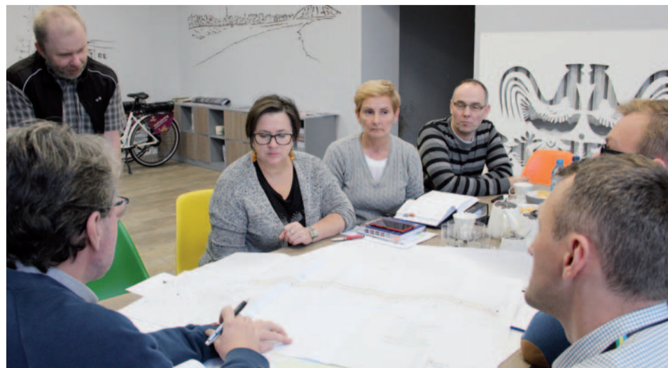
Urzednicy przedstawili rowerzystom z projekt nowych ścieżek rowerowych

Urząd Miasta i przedstawiciele środowiska rowerowego spotkali się w Wydziale Promocji Miasta, Kultury i Sportu, by porozmawiać w sprawie rozbudowy ścieżek rowerowych w Ostrołęce. Członkowie Stowarzyszenia Ekomena i Klubu Kolarskiego 24h przedstawili swoje pomysły na poprawę dotychczasowych rozwiązań.