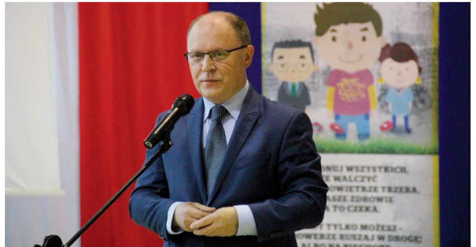
W Ostrołęce wojewoda zainicjował akcję „Odetchnij! Czyste mazowieckie”

Edukacyjny projekt ekologiczny pod hasłem „Odetchnij! Czyste mazowieckie” zainaugurował w Szkole Podstawowej nr 3 w Ostrołęce Wojewoda Mazowiecki Zdzisław Sipiera. Projekt realizowany będzie w stu mazowieckich szkołach podstawowych.