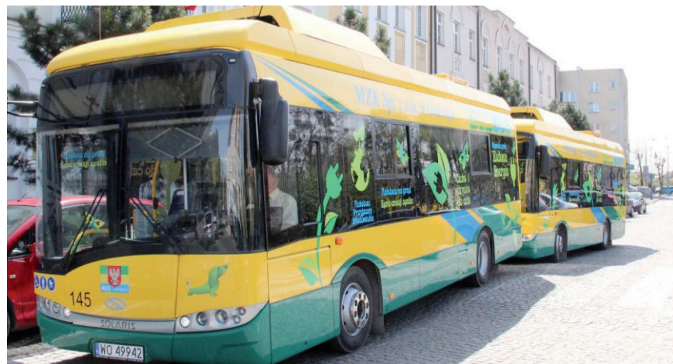
Ostrołce przybędą kolejne elektrobusesy