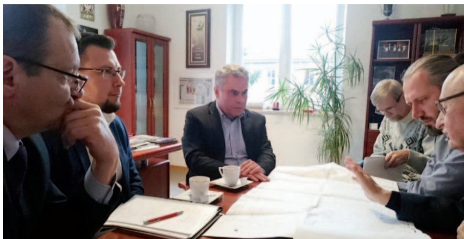
Zarząd PZLA zapoznał się z projektem ostrołęckiego stadionu