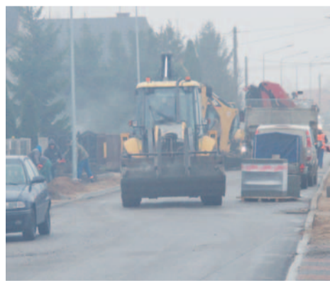
Budowa ul. Wiejskiej dobiega końca

Mimo opóźnień związanych z wymianą podłoża i deszczową jesienią dobiega końca budowa ulicy Wiejskiej. Kiedy ten numer gazety trafi do rąk czytelników, mieszkańcy osiedla Stacja będą już korzystać z nowej drogi.