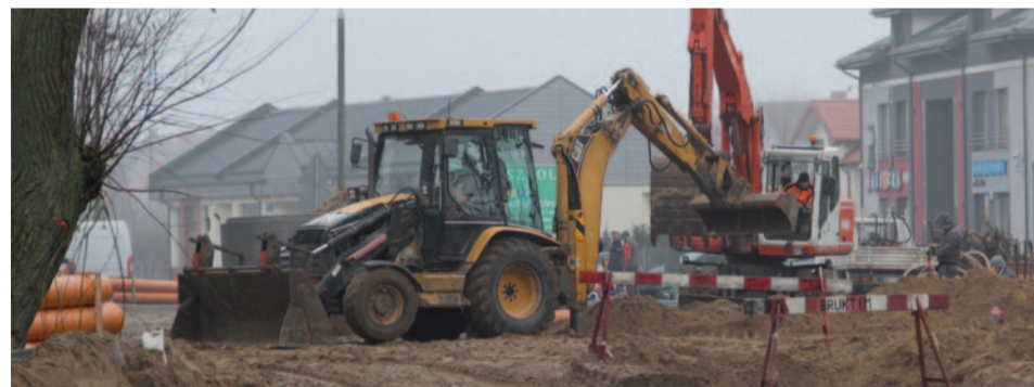
Trwają prace przy sieci kanalizacyjnej w ul. Dobrzańskiego

Trwają prace ziemne przy budowie ulicy Dobrzańskiego na odcinku od ulicy gen. Fieldorfa „Nila” do ulicy 11 Listopada.