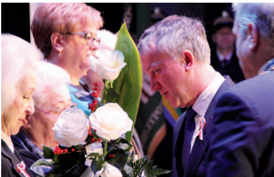
Prezydent i przewodniczący wręczyli odznaki „Za zasługi dla Miasta Ostrołęki”