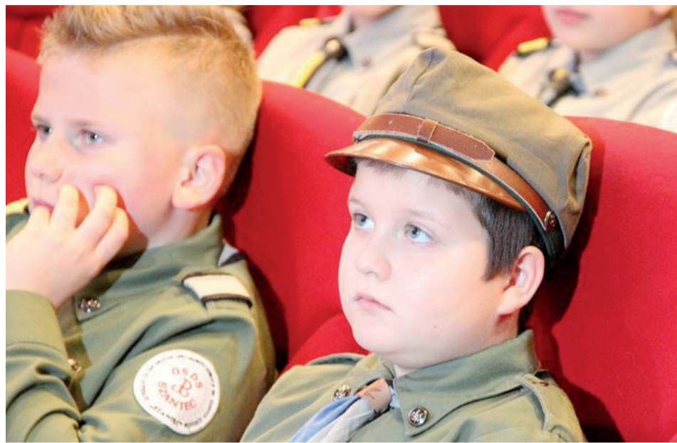
Liczną grupę gości podczas uroczystej sesji stanowili harcerze