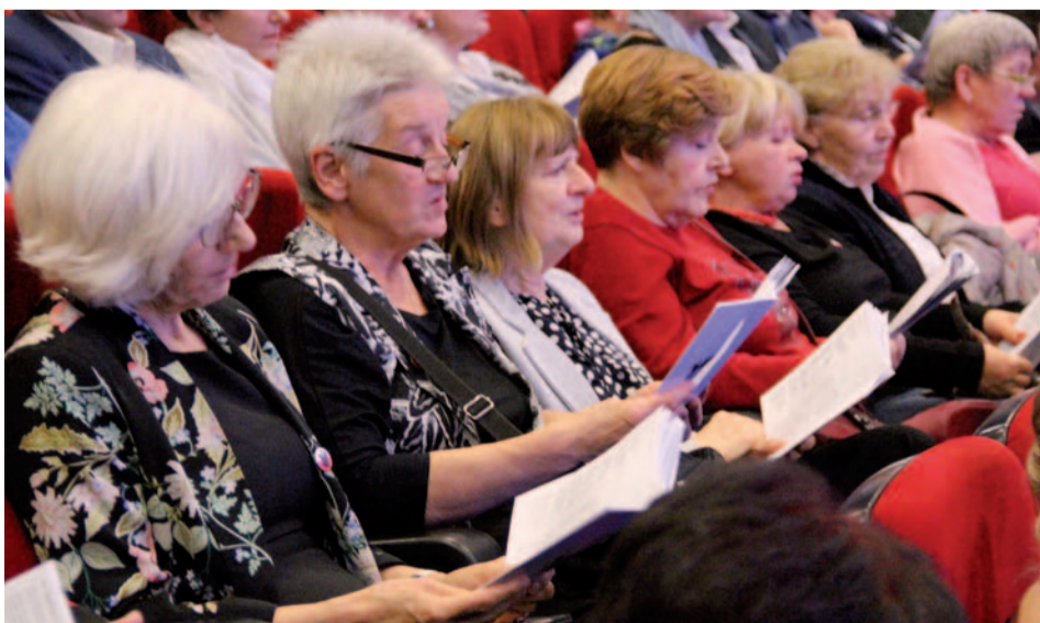
Wspólne wykonanie pieśni ułatwiły wydrukowane przez samorząd Ostrołęki i MKK śpiewniki