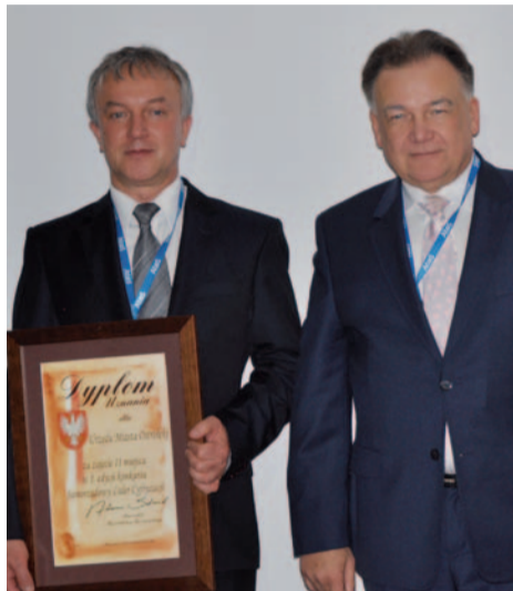
Ostrołęcki samorząd został wyróżniony za cyfryzację

Sprawny urząd to dziś nie tylko wykwalifikowani pracownicy. Wiele zależy od wdrożonych, innowacyjnych projektów informatycznych, które pozwalają usprawnić pracę i podnieść jej efektywność. Ostrołęka w tym zakresie znajduje się w czołówce miast na Mazowszu.