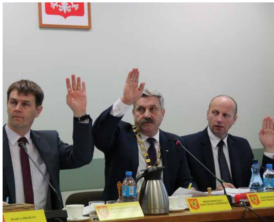
Prezydium Rady Miasta Ostrołęki

Podczas grudniowej sesji nikt spośród radnych nie głosował przeciw uchwaleniu miejskiego budżetu na 2017 rok. Za zaproponowanym przez prezydenta projektem głosowało 16 osób, 4 wstrzymały się od głosu.