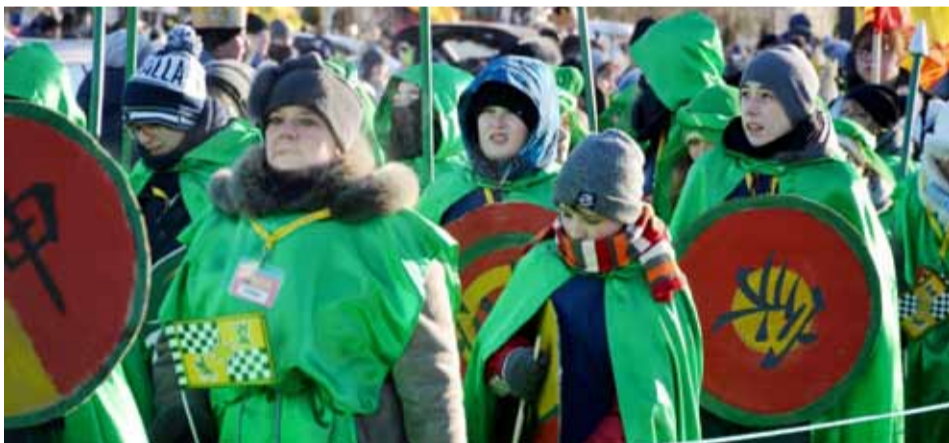
W Orszaku licznie uczestniczyli mieszkańcy miasta, wśród nich samorządowcy