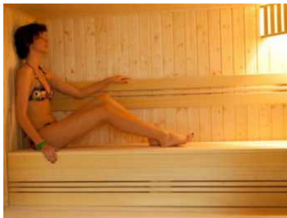
W Parku Wodnym gruntownemu remontowi poddano saunę