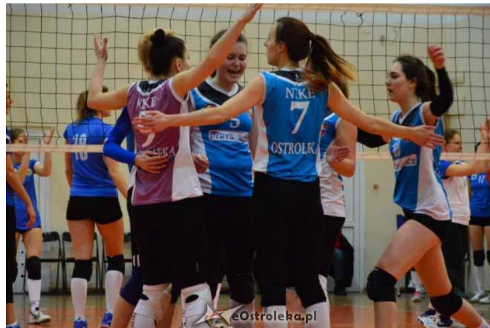
Seniorki Nike podczas meczu z SPS Konstancin Jeziorna