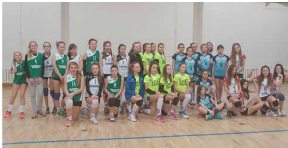
Część uczestniczek jubileuszowego turnieju rozgrywająca swoje mecze w Gimnazjum nr 2

W ciągu 10 lat działalności OTPS Nike dochowało się kilku reprezentan-