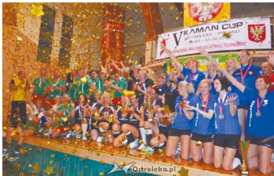
Zwycięzcy V Kaman Cup Ostrołęka 2016

Trwa konkurs ofert na realizację zadań publicznych z zakresu kultury fizycznej, w tym roku po raz pierwszy przy wykorzystaniu systemu internetowego Witkac.pl. W budżecie przeznaczono na ten cel kwotę 1.400.000 zł. Dla porównania sąsiednia Łomża przekazała klubom i stowarzyszeniom dotacje na łączną sumę 1 mln zł, a powiat ostrołęcki 70 tys. zł. W jednym z kolejnych numerów „Ostrołęcki Samorządowej” poinformujemy o rozstrzygnięciu tegorocznego konkursu, a poniżej przedstawiamy podsumowanie zadań dofinansowanych przez ostrołęcki samorząd w minionym roku.