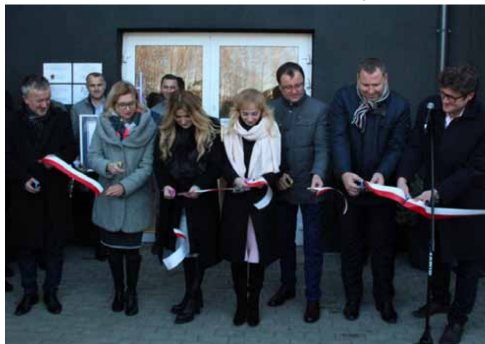
Oficjalnego przecięcia wstęgi dokonali przedstawiciele władz i Fundacji

12 grudnia oficjalnie zainaugurowano działalność Multimedialnego Centrum Natura.