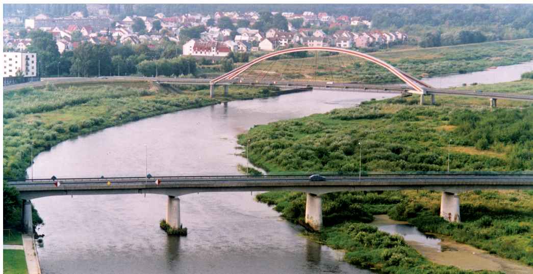
Być może już niebawem Ostrołęka wzbogaci się o trzeci most

realizacji RIT jest współpraca, dlatego samorządy chcące realizować RIT są zobligowane do zawiązania dowolnej formy partnerstwa np. stowarzyszenia, związku międzygminnego, porozumienia międzygminnego lub podpisanie listu intencyjnego w celu realizacji wspólnych zamierzeń.