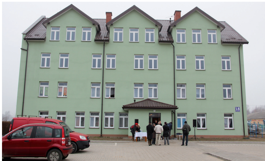
Budynek przy Kołobrzeskiej po gruntownej modernizacji

Łączny koszt przebudowy wyniósł około 2,2 mln zł. Inwestycja wsparta została kwotą około 531 tys. zł. pochodzącą ze środków Banku Gospodarki Krajowej. To kolejne mieszkania socjalne oddane do użytku w ciągu drugiej już kadencji obecnych władz miasta. Wcześniej samorząd wybudował blok socjalny przy ulicy Koszarowej i wyremontował były hotel pielęgniarski przy ulicy Sienkiewicza. Obecnie trwa budowa kolejnych kilkudziesięciu mieszkań przy ulicy Braterstwa Broni. Do nowego bloku mieszkańcy powinni wprowadzić się już jesienią 2014 roku.