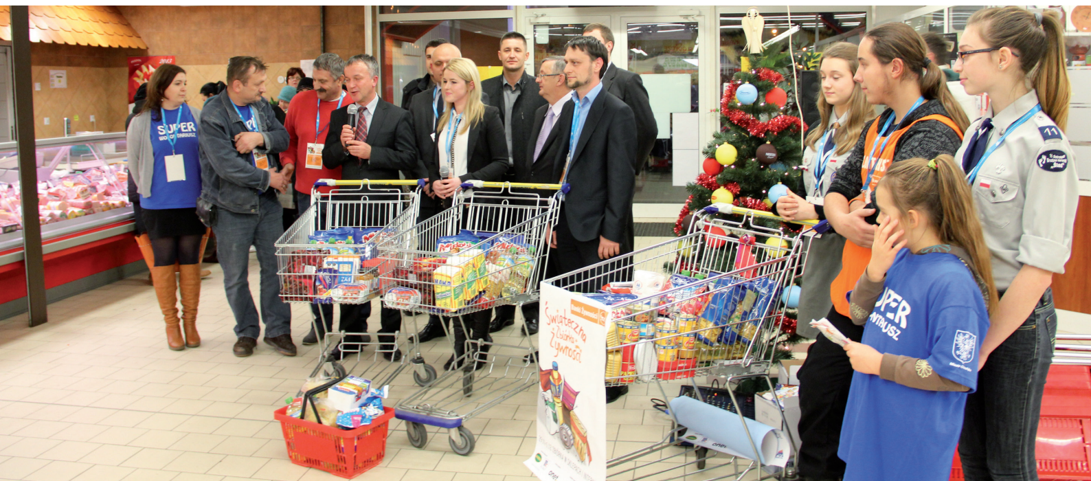
Jedną z wielu akcji dobroczynnych w Ostrołęce była Świąteczna Zbiórka Żywności

zbrano ponad 60 tys. zł a na ulicach Ostrołęki kwestowało ponad 300 osób. Ostrołęcki wolontariat to nie tylko duże akcje społeczne. Wolontariusze swoją pracą wspierają m.in. inicjatywę Miejskiego Ośrodka Pomocy Rodzinie czy Domu Pomocy Społecznej oraz