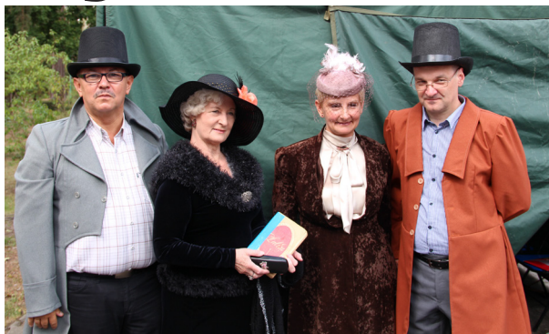
Czytający „Lalkę” dopasowali się do epoki strojami