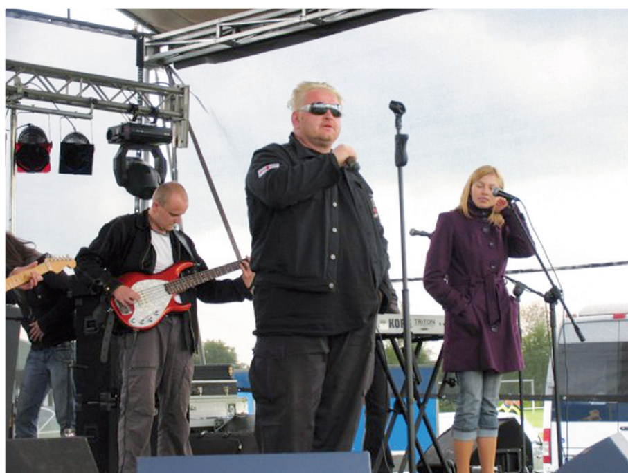
Zdjęcie ze strony www.fns.pl , autor