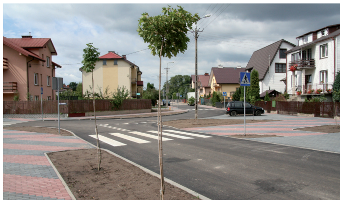
Wyremontowana ulica Jarzębinowa

nej ulicy. Jej wygląd będzie na pewno miłym zaskoczeniem dla powracających po wakacjach uczniów i pedagogów placówki. Poprawi też zdecydowanie komfort dojazdu pozostałym mieszkańcom osiedla. Podobnie jest z ulicą Wypychy, gdzie zakończono ostatnie roboty. Obie