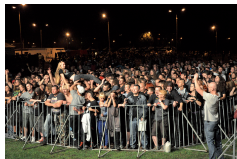
Na występ zespołu Illusion czekały tłumy Ostrołęczan