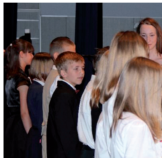
Wręczenie nagród najlepszym uczniom podczas Samorządowej G

Poza termomodernizacjami SP nr 10 i Przedszkola Miejskiego nr 5 prowadzonych jest wiele prac adaptacyjnych i remontowych innych ostrołęckich szkołach. Między innymi ostatecznie zagospodarowany zostanie