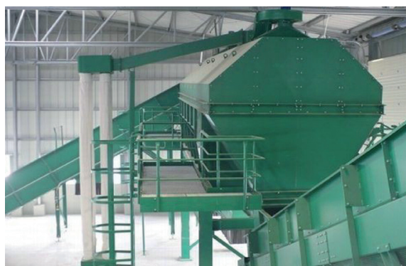
Fragment instalacji SSOK

Stacja segregacji odpadów powstanie w bezpośrednim sąsiedztwie miejskiego wysypiska przy ulicy Turckiego.