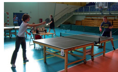
W czasie wakacji dzieci uczestniczyły w zawodach tenisa stołowego

Podczas tegorocznej akcji szczególnie dużym zainteresowaniem cieszyły się zajęcia w ramach Wakacyjnej Szkoły Tenisa Ziemnego zorganizowane wspólnie z Ostrołęckim Stowarzyszeniem Tenisowym. W dwóch 5-dniowych cyklach nauki podstaw tenisa ziemnego brało udział blisko osiemdziesięcioro dzieci. Tradycyjnie rozgrywane były także turnieje „dzikich drużyn” w siatkówce, koszykówce oraz piłce nożnej, a także turnieje amatorskie w tenisie stołowym i ziemnym. W sierpniu zorganizowany został dla najmłodszych ostrołęczan festyn sportowo – rekreacyjny, podczas którego aktywnie bawi-