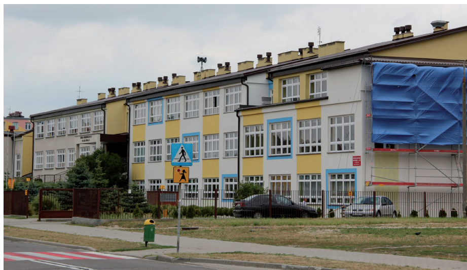
Termomodernizacja Szkoły Podstawowej Nr 10

Przygotowujemy się do wdrożenia w szkołach ponadgimnazjalnych tj. I LO, II LO, ZS nr 5, ZSZ nr 1, ZSZ nr 2, ZSZ nr 3, ZSZ nr 4, Zespołach Szkół nr 3 i 4 oraz Gimnazjach nr 1 i 2, systemu kontroli dostępu (wejść i wyjść), opartego na kluczach elektronicznych, w ramach projektu „Bezpieczna