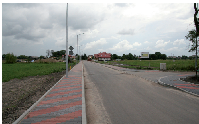
Ulica Wypychy po remoncie

ulice otrzymały nowe chodniki z kostki brukowej. To kolejne inwestycje drogowe realizowane na Stacji w ostatnich latach. Dzięki nim stopniowo zmienia się wizerunek osiedla, jak twierdzili do niedawna mieszkańcy, zapomniane-