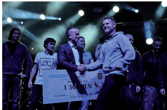
Zwycięzca przeglądu, zespół Messa z Olsztyna, fot. Paweł Osłowski, eOstroleka.pl

wych rytmów. Na scenie konkursowej wystąpiło dziesięć zespołów. Jury przyznało laur zwycięzcy olsztyńskiej Messie , która otrzymała z rąk pre-