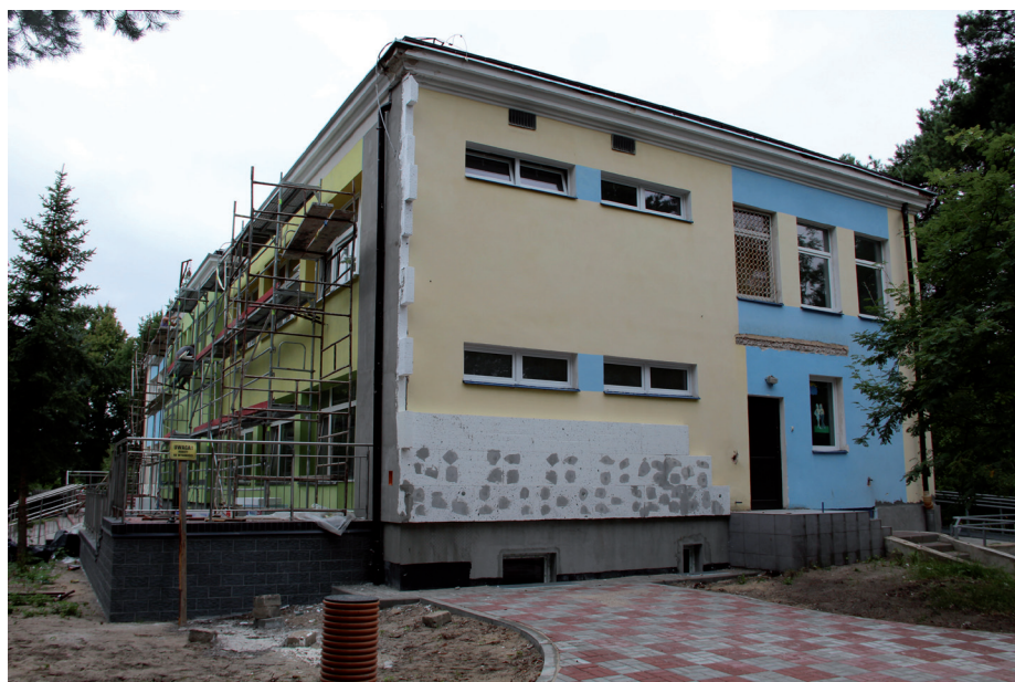
Termomodernizacja Przedszkola Miejskiego Nr 5

Szkoła”, połączonego z programem edukacji ekonomicznej. Ponadto szkoły zostaną wyposażone w komputery – rejestratory wejść/wyjść i monitory ciekłokrystaliczne. Pracownicy i uczniowie będą posiadali karty elektroniczne otwierające drzwi, co ograniczy dostęp osób postronnych do placówek. Są to nowoczesne rozwiązania wykorzystywane przez samorządy, które umożliwiają podwyższenie bezpieczeństwa w szkołach oraz monitorowanie frekwencji uczniów. Ostrołęckie szkoły znajdą się w gronie 100 placówek oświatowych w skali kraju, które będą wyposażone w ten system.